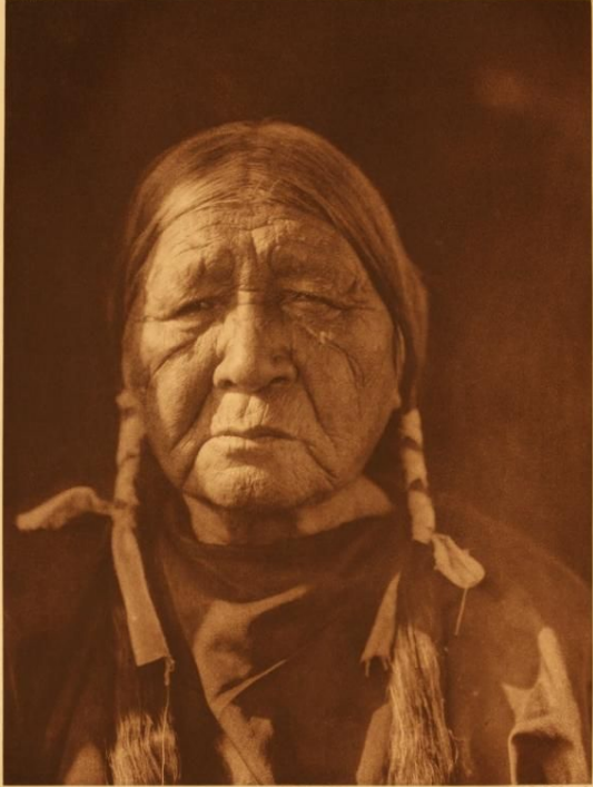
U'KIP - GORATYER