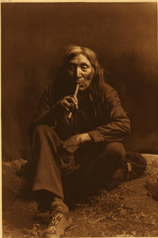
CHIEF RED JACKET - SENEGA