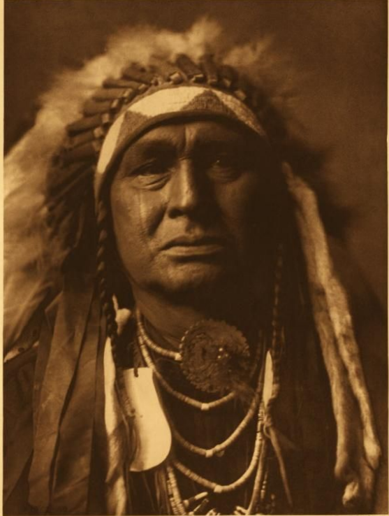
WITTE DEN BUIS DEK - AFRANDER