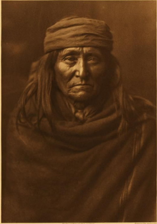
GAZDI - KADIK