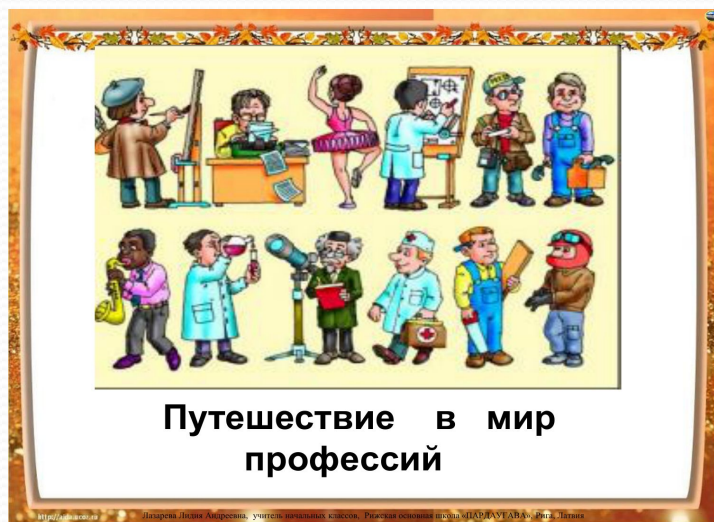
Путешествие в мир профессий

На этой стадии возможен конфликт между инициативой и чувством вины. Благоприятное разрешение конфликта – цель.