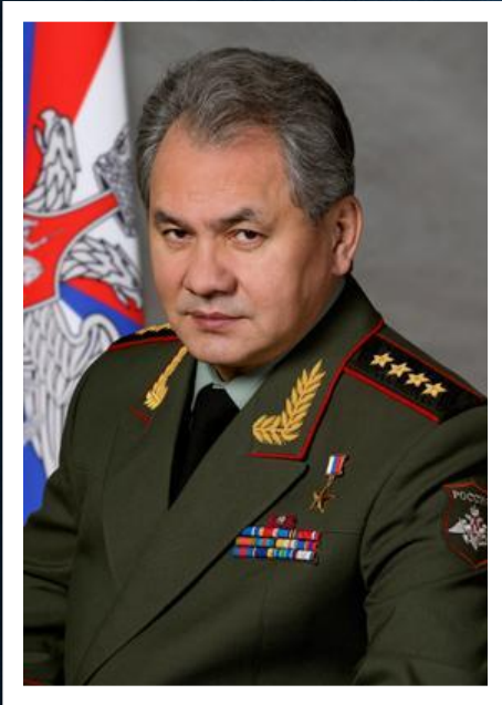
ШОЙГУ СЕРГЕЙ КУЖУТЕТОВИЧ, министр Российской Федерации по делам гражданской обороны, чрезвычайным ситуациям и ликвидации последствий стихийных бедствий. Генерал армии. Герой Российской Федерации.