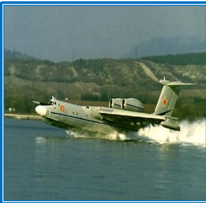
самолет-амфибия А-40 Альбатрос