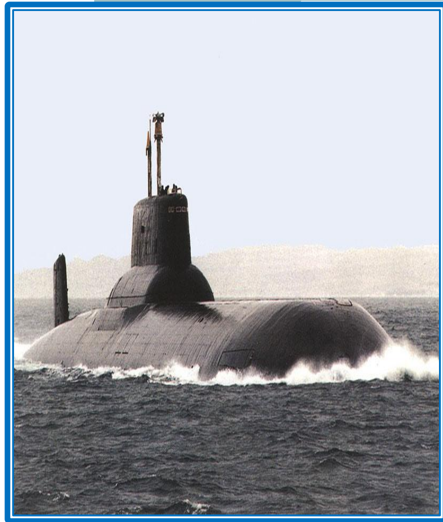
тяжелый атомный подводный крейсер