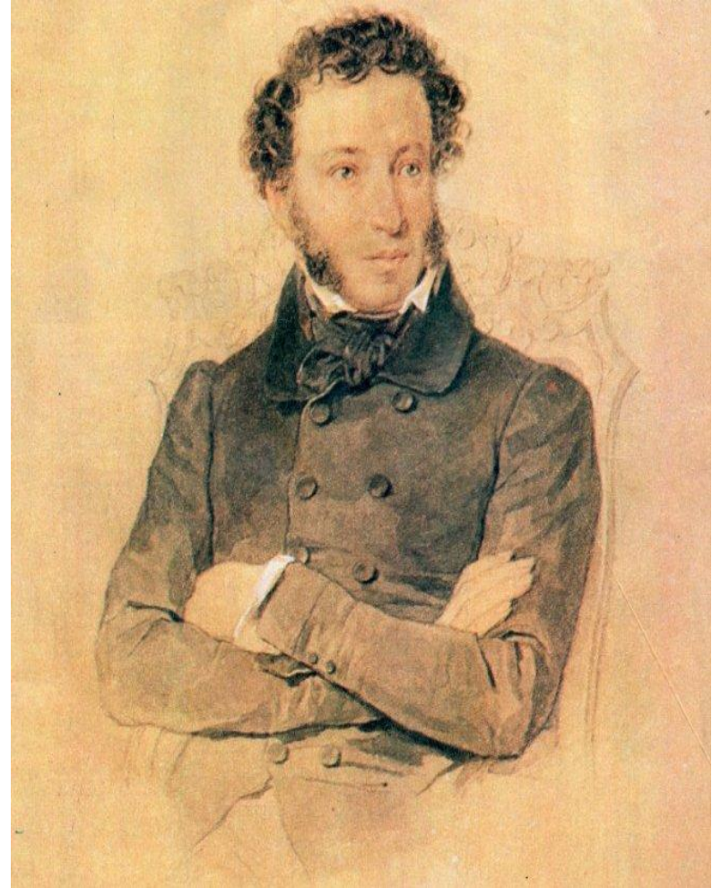
Художник Петр Соколов. 1836.