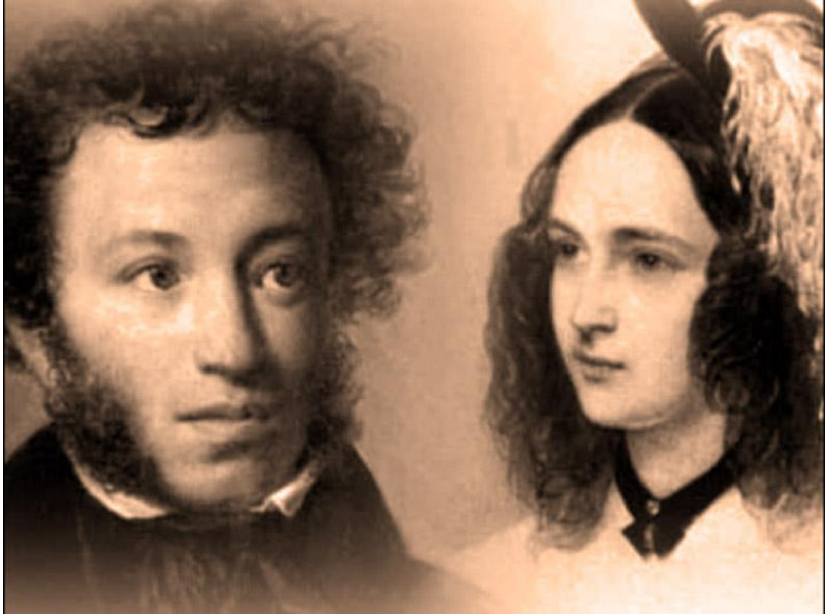
Александр Сергеевич Пушкин (1799 - 1837) и Наталья Николаевна Гончарова (1812 - 1863).