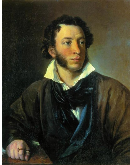
В. А. ТРОПИНИН. ПОРТРЕТ А. С. ПУШКИНА, 1827.

ИТАК, В ЧЕМ ТАЙНА ПУШКИНСКОГО ГЕНИЯ И НЕПРЕХОДЯЩАЯ ЦЕННОСТЬ ЕГО ПОЭТИЧЕСКИХ ТВОРЕНИЙ?