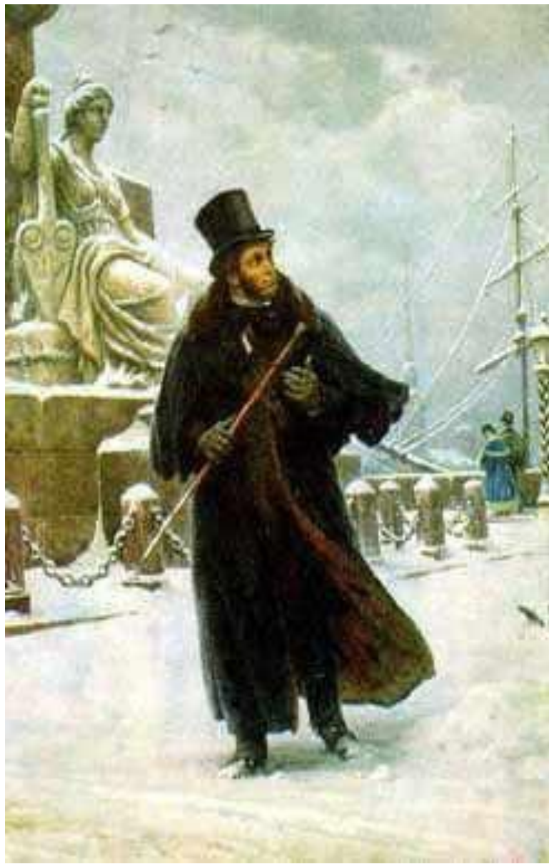
Б.В. Щербаков. `Пушкин в Петербурге`. 1949 г.

«Жил бы Пушкин долее, так и между нами было бы меньше споров, чем видим теперь. Но Бог судил иначе, Пушкин умер в полном развитии своих сил и бесспорно унес с собой в гроб некоторую великую тайну. И вот мы теперь без него эту тайну разгадываем».