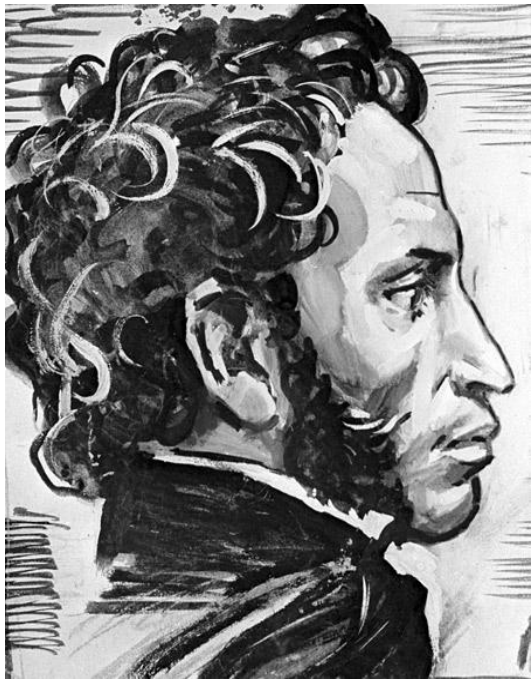
Репродукция эскиза к портрету А. С. Пушкина работы художника Ярослава Манухина.