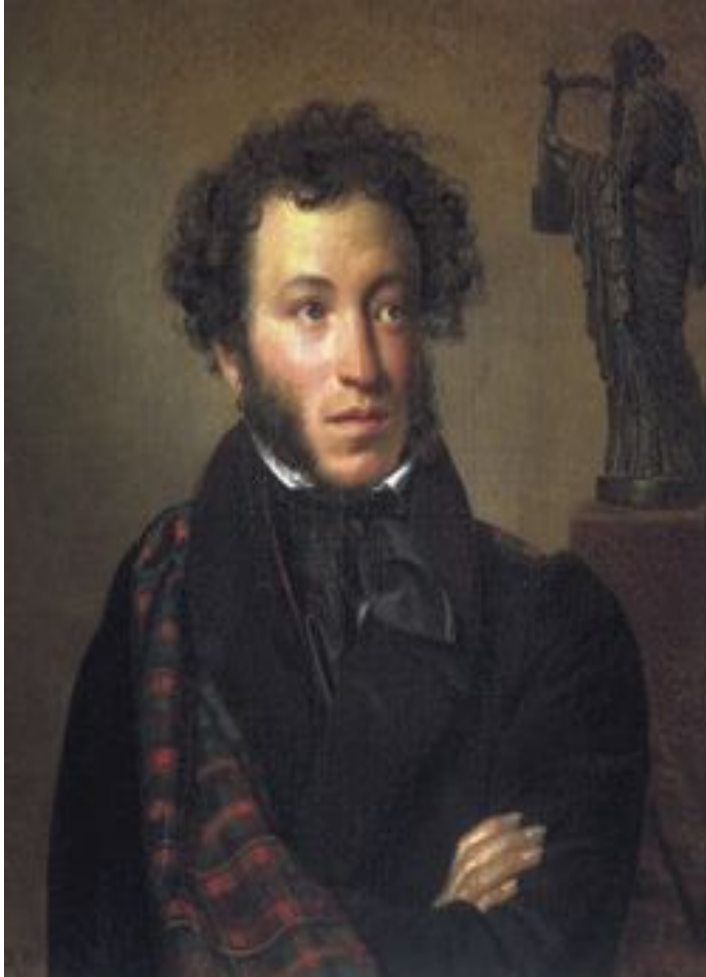
Портрет работы О. А. Кипренского. Пушкин: «Себя как в зеркале я вижу, но это зеркало мне льстит».