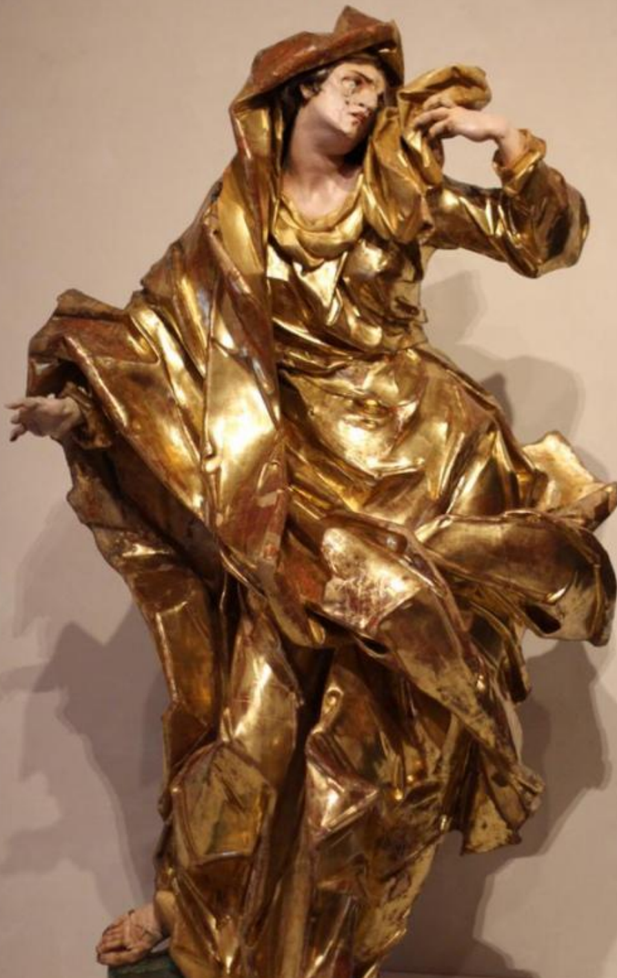
І. Пінзель. Марія