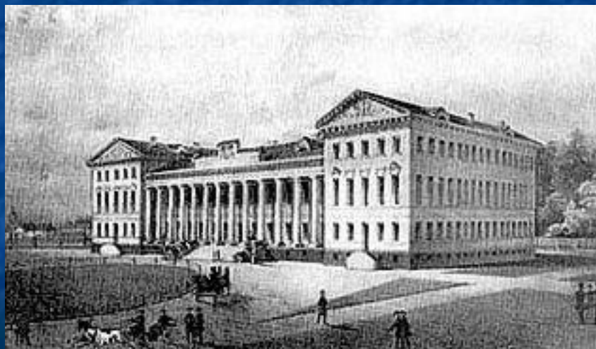
Нежин. Гимназия высших наук