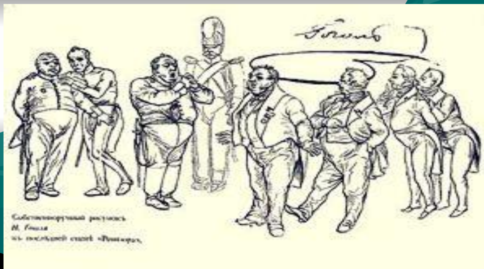
Собственноручный рисунок Н.В. Гоголя к последней сцене "Ревизора"