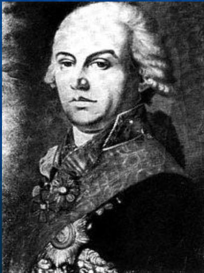
Дмитрий Прокопович Трощинский