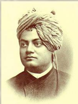
Вивекананда (1869-1902 гг.)

□ 3 этап – философия и практика йоги Нового и Новейшего времени – XIX-XXI вв. В XVIII-XIX веках Западный мир начинает знакомиться с восточными йогическими учениями.