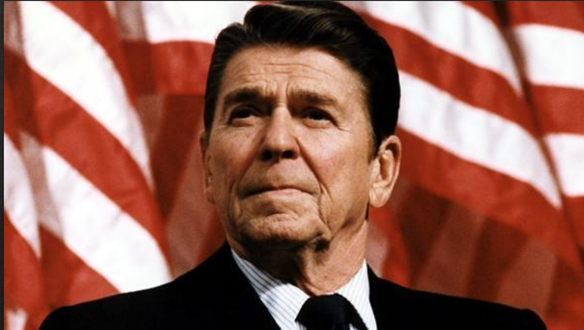
40 Президент США Рональд Рейган

Отношения между США и СССР ещё более обострились после прихода к власти в США Р. Рейгана, считавшего, что Картер ведёт себя СЛИШКОМ МЯГКО.