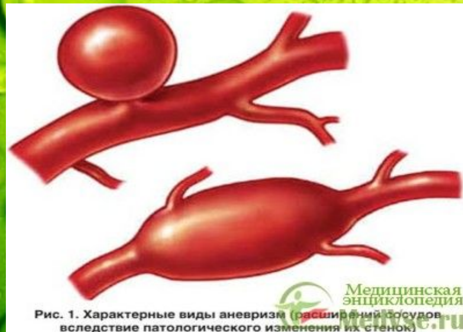
Рис. 1. Характерные виды аневризм (расширение сосудов вследствие патологического изменения их стенок)