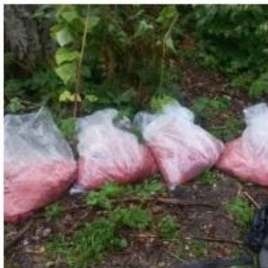
Более 100 кг икры заготовили браконьеры за несколько часов на Сахалине