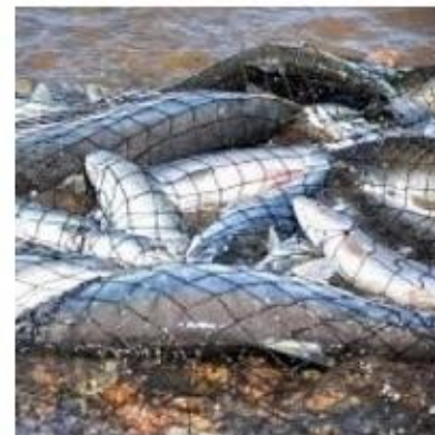
Около тонны горбуши похитил гражданин из ближнего зарубежья на Сахалине