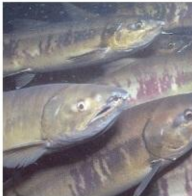
На Сахалине задержаны браконьеры, осуществляющие незаконную добычу кеты