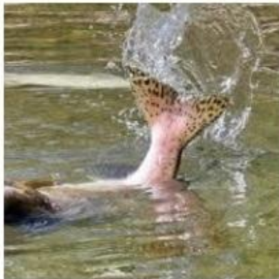
На Сахалине задержана преступная группа, осуществляющая незаконную добычу и переработку рыбы