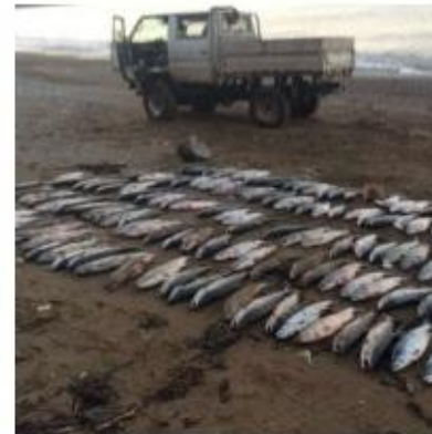
На Сахалине задержаны граждане, осуществлявшие незаконный вылов кеты