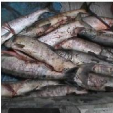
Браконьеры незаконно выловили более трех тонн рыбы на Сахалине