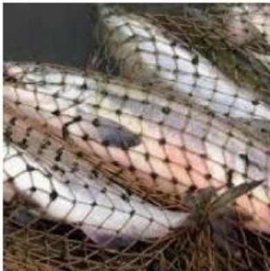
Житель Анивского района привлечен к уголовной ответственности за незаконную добычу рыбы

На Сахалине и Дальнем Востоке большинство уголовных дел возбуждаются по п."в" ч.1 ст.256 - незаконная добыча в местах нереста или на миграционных путях к ним, а также по ч.3 этой же статьи.