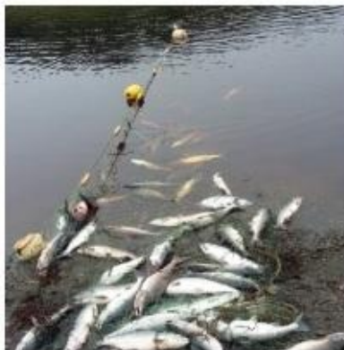
Работник заповедника «Поронайский» руководил группой браконьеров