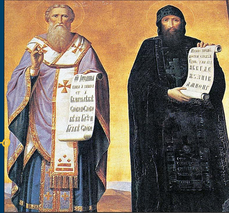
Икона. «Кирилл и Мефодий», XIX в.