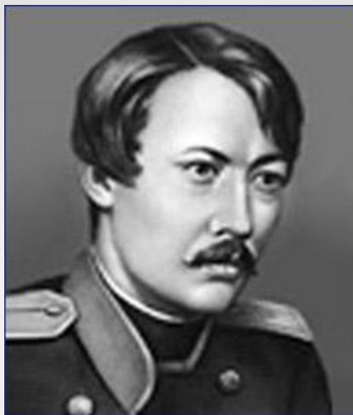
Чокан Валиханов (1835-1865гг)