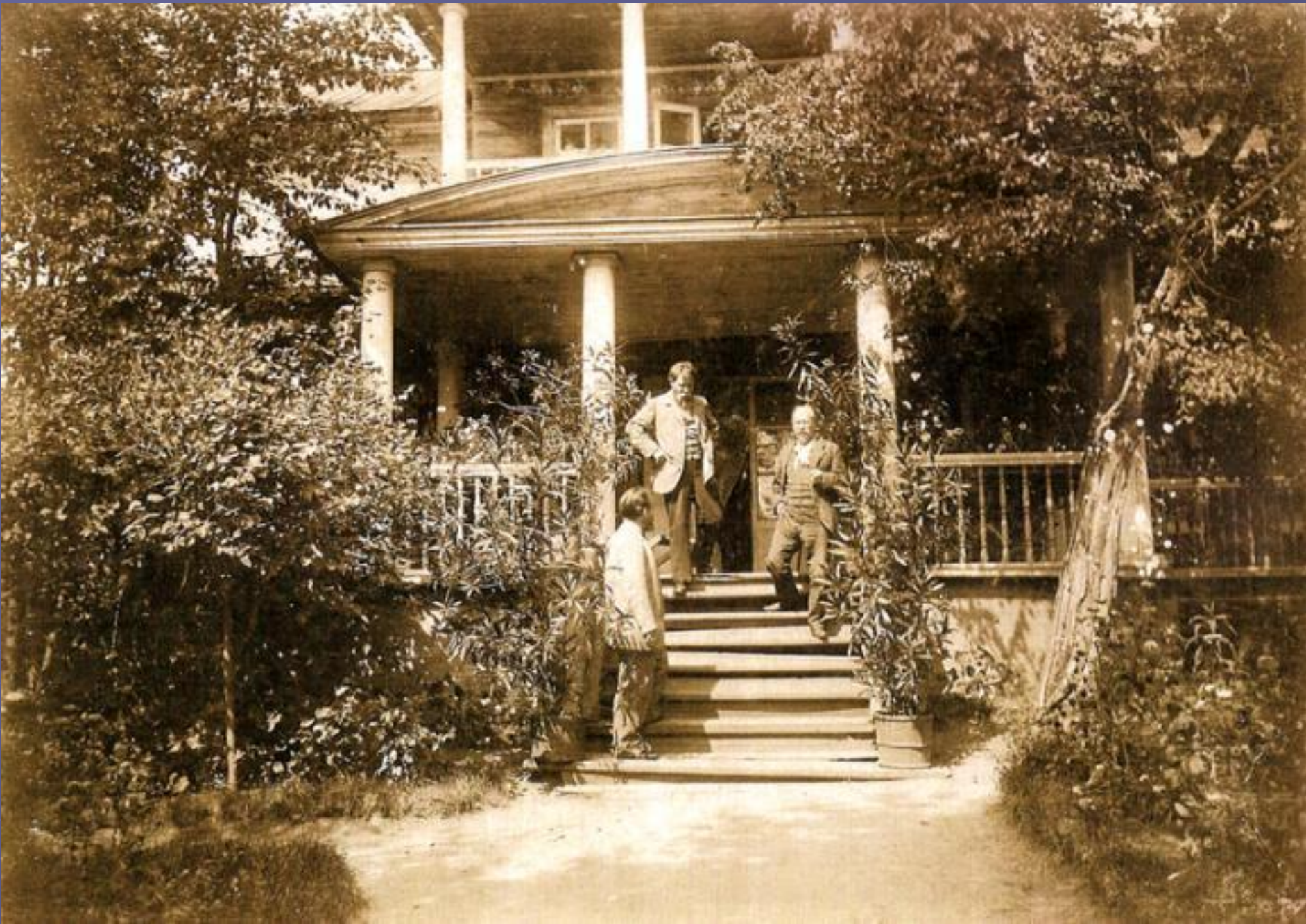
На крыльце господского дома в имени Михайловский завод