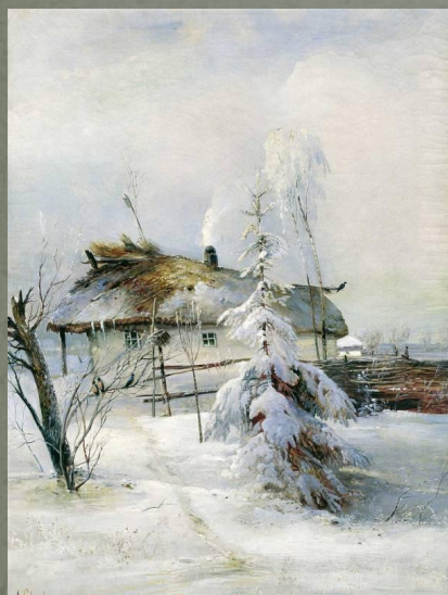
А. Саврасов «Зима» 1873