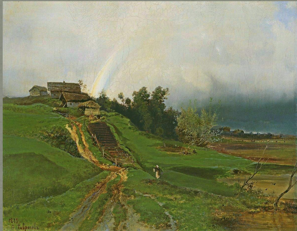
А. Саврасов «Радуга» 1875

● Мы видим картину Алексея Саврасова «Радуга», написанную в 1875 году. Саврасов не раз изображал это прекрасное явление природы, в котором издревле виделся глубокий смысл. Мы видим стоящую на пригорке деревушку, к которой от реки поднимается тропинка с выложенной по склону лесенкой. Радует взгляд влажный бархат зеленой травы, солнечный свет, пробивающийся сквозь тучи, и нежная, как бы тающая в высоте, растворяющаяся в тайне небес радуга. Здесь столько любви и поэзии, что обычный деревенский мотив воспринимается как образ "лестницы" или «моста», соединяющих мир земли и неба, приглашающих к духовному восхождению, приобщению к светлым силам мироздания.