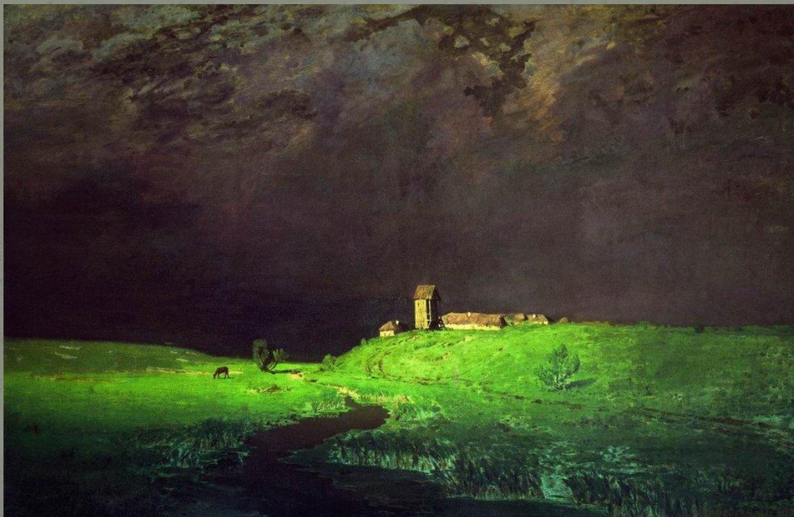
А. Куинджи «После дождя» 1879

● Картина 1879 года «После дождя» тоже близка романтическим произведениям прежде всего сюжетно. Кунджи передает бурное состояние природы, делает её образ психологичным, бунтарским и прекрасным. Свобода и эмоциональность пейзажа в стремительном движении туч, в яркости и свежести красок трав, в контрасте между световым пятном земли и темной угрозой неба. Мы видим, что художник ввёл в русский пейзаж резкие контрасты, световые пятна и яркий цвет, которые стали основным средством достижения красоты. Для русского искусства это стало новаторством - ранее подобные средства не применялись. Вспомним неброскую прелесть картин Алексея Саврасова.