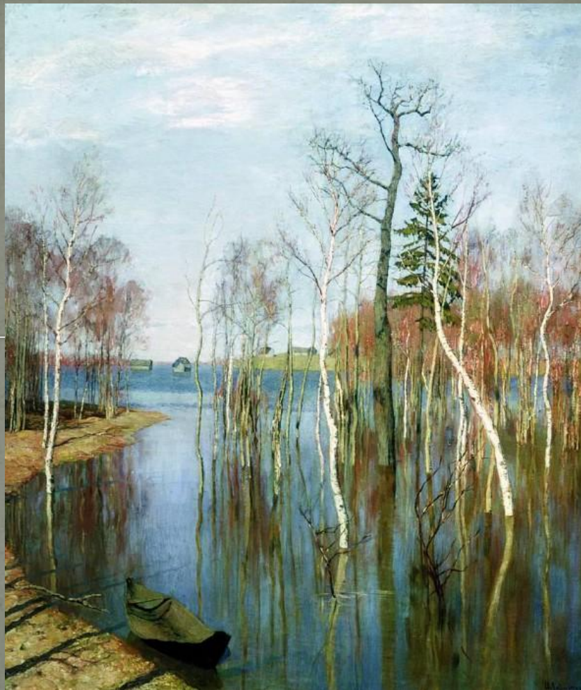
И. Левитан. «Весна. Большая вода» 1897

Русский пейзаж XIX века формировался на стыке романтической традиции самоценности и духовно-целительной силы проявлений Природы как индивидуального субъекта бытия и реалистической позиции, согласно которой действительность должна быть запечатлена максимально точно и объективно. Язык пейзажа стал, подобно поэзии, способом проявления высоких чувств художника. Образ природы, как и облик человека, отражает в себе жизнь, чувства и мысли того общества, которое воспитало его создателя. С его помощью мы учимся понимать окружающую нас жизнь и самих себя.