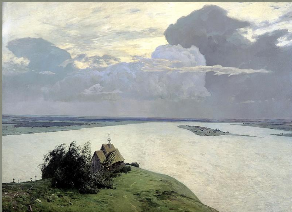
И. Левитан «Над вечным покоем» 1894

Образ маленькой церквушки – это образ самого человека, ищущего на земле правду, стремящегося к свету, к любви, но часто не обретающего их. Это картина о мимолетности жизни, но и о надежде, что каждый из нас чувствует свою связь с чем-то грандиозным. Это тихая, величественная Родина, она не просто место рождения, но и духовное пристанище, дающее ощущение единения и слияния с окружающим, дарующее, наконец, усталому страннику Вечный Покой.