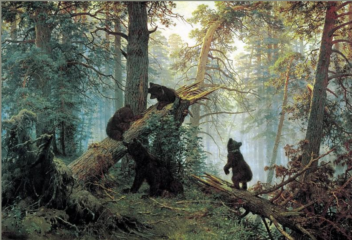
И. Шишкин «Утро в сосновом лесу» 1889

● Полотно Шишкина «Утро в сосновом лесу», созданное в 1889 году, погружает нас в атмосферу утреннего леса. Солнце уже золотит верхушки деревьев. Они стоят плотной стеной, защищая от нескромных глаз небольшую полянку, где расположилась семья медведей. Двое медвежат забрались на ствол поваленного грозой дерева. А третий встал на здание лапки и вытянул мордочку навстречу нежному зарождающемуся дню. Благодаря волшебству кисти художника, мы словно наяву слышим голоса птиц и рёв медвежат, вдыхаем аромат сосновой коры и хвои.