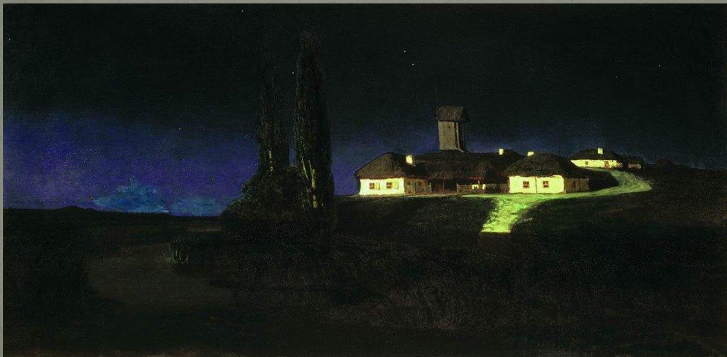
А. Куинджи «Украинская ночь» 1876