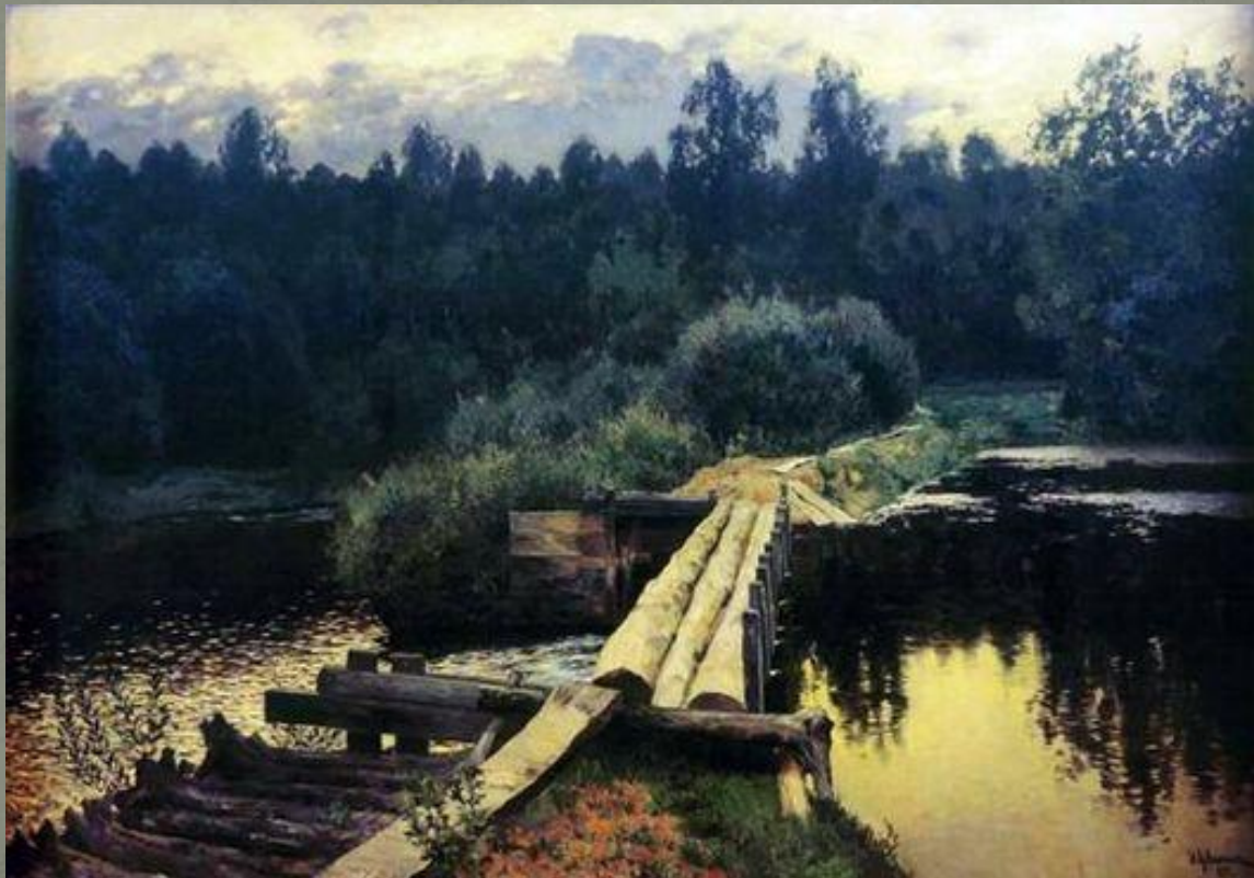
И. Левитан «У омута» 1892