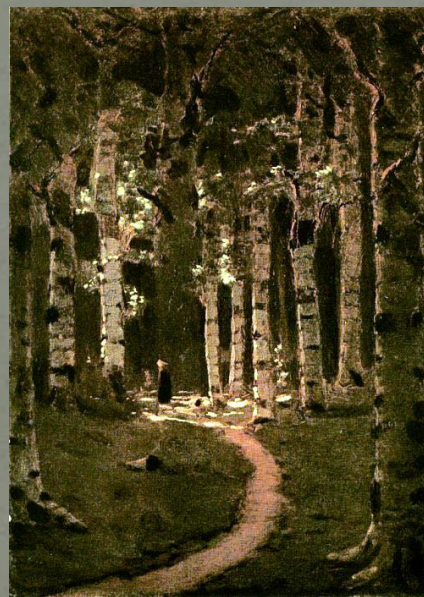
А. Куинджи «Березовая роща» 1880-е