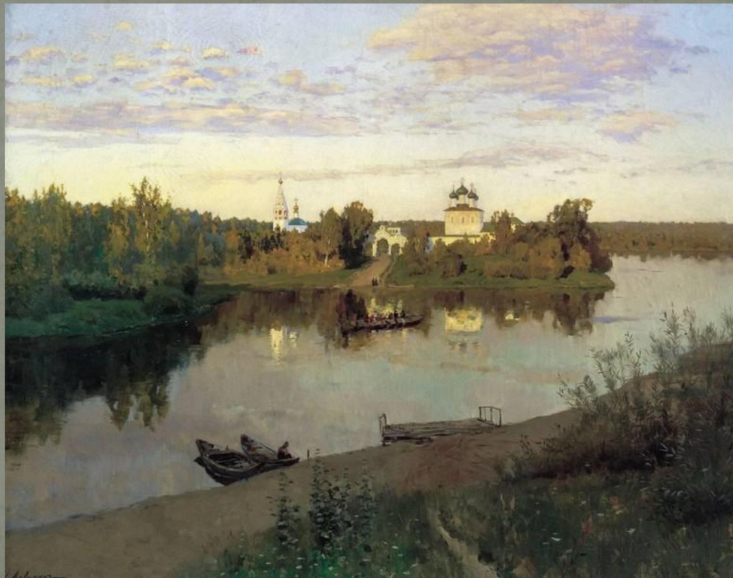
И. Левитан «Вечерний звон» 1892