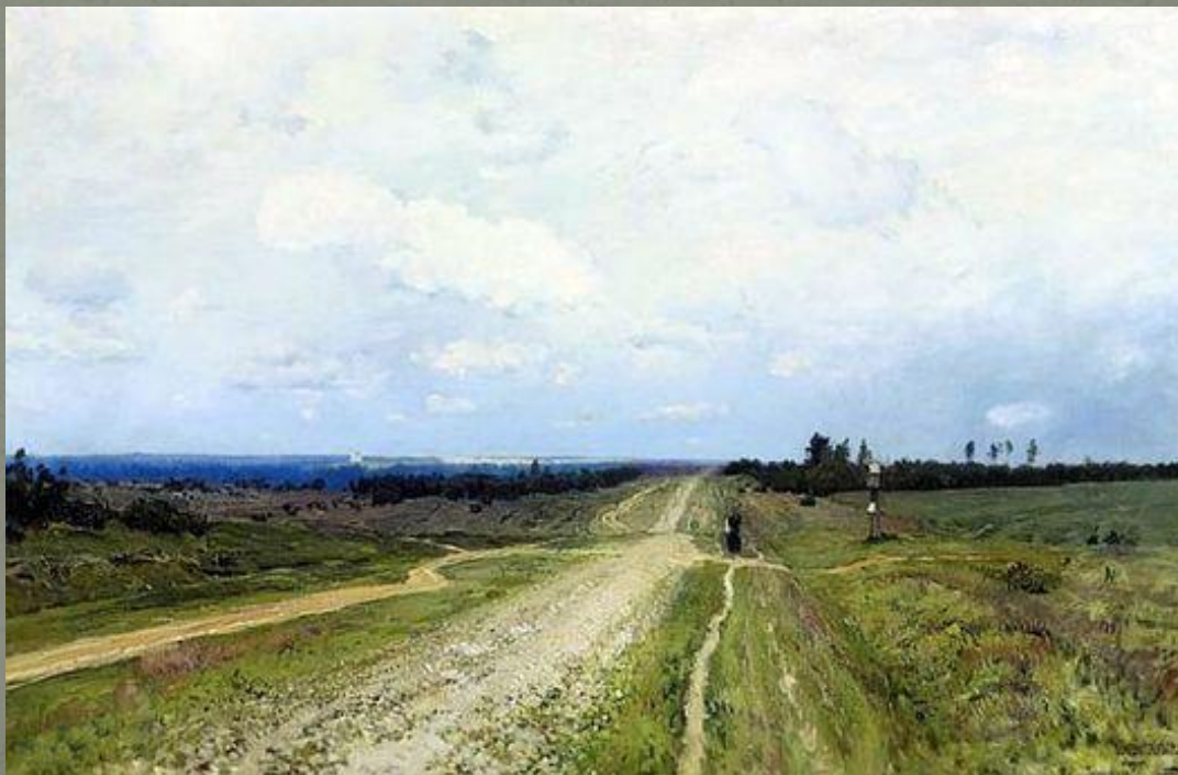
И. Левитан «Владимирка» 1892