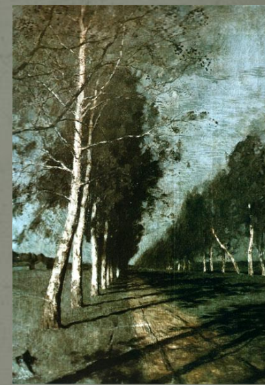
И. Левитан Лунная ночь 1897