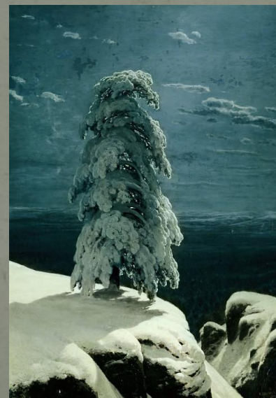
И. Шишкин «На севере диком...» 1891