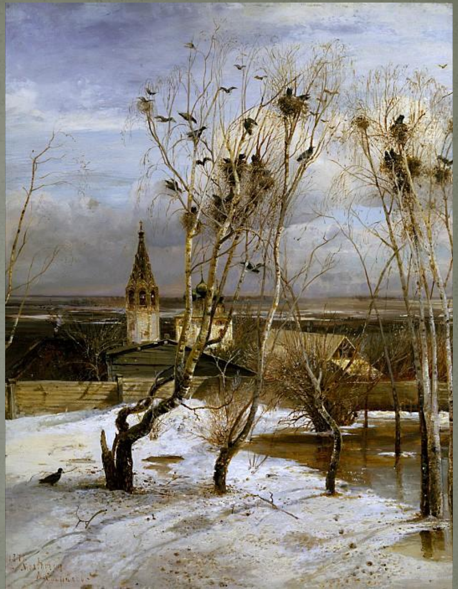
А. Саврасов «Грачи прилетели» 1871

● Картина 1871 года «Грачи прилетели» - наиболее известное произведение художника. Саврасов удивительно точно воспроизводит начало пробуждения русской природы, перехода жизни в качественно иное состояние. Черные ветви берёз прорезали хмурые облака и тянутся к едва светлеющему синему небу. Снег еще не сошёл, но серые сугробы освещены солнцем. Люди, возможно, еще не ощутили дыхания весны, но птицы, более чуткие, чем люди, полны весенними хлопотами... Картина вызывает ощущение покоя и тревоги, затаенной печали и ожидания нового счастья одновременно. Эта картина – настоящий гимн родной русской природе, пробуждающейся от зимнего сна и обновляющейся на глазах, словно человеческая душа, оттаивающая после тяжёлых испытаний.