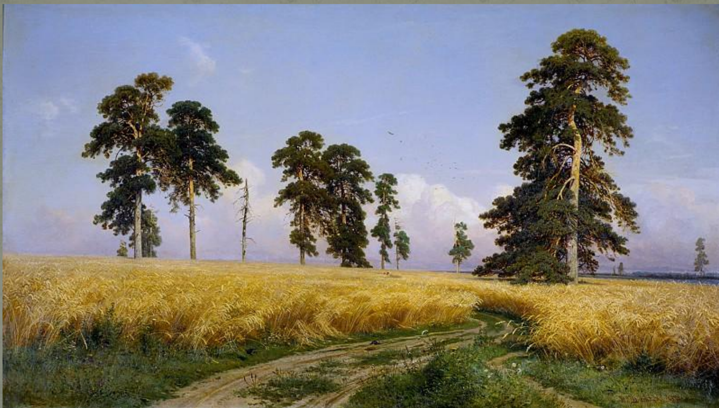
И. Шишкин «Рожь» 1878