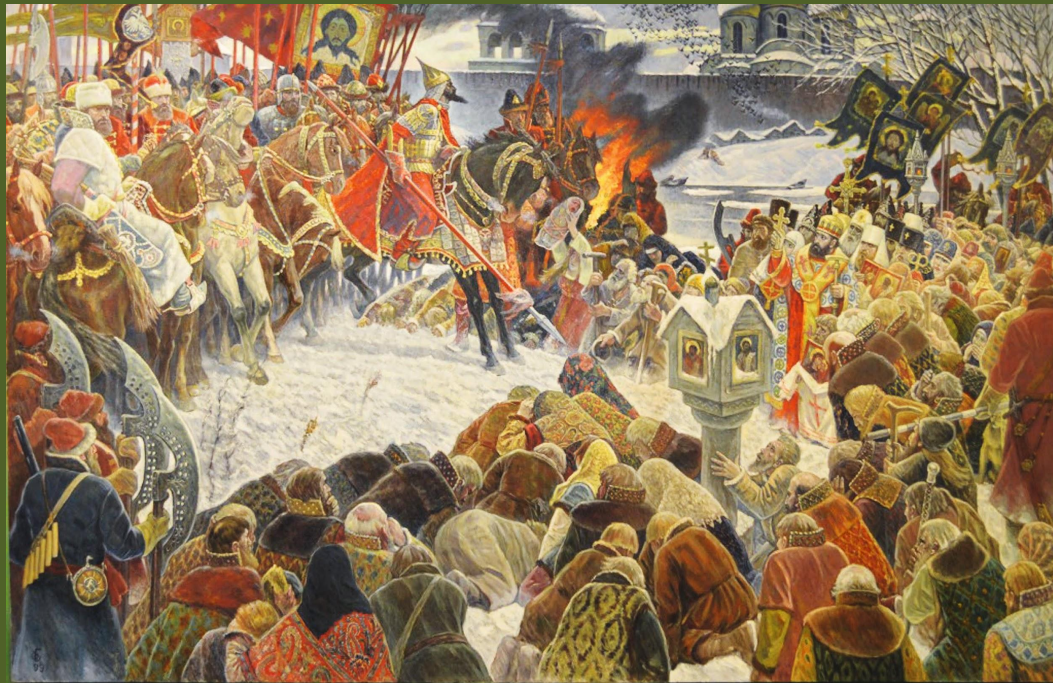
«Опричнина». Картина Ореста Бетехтина