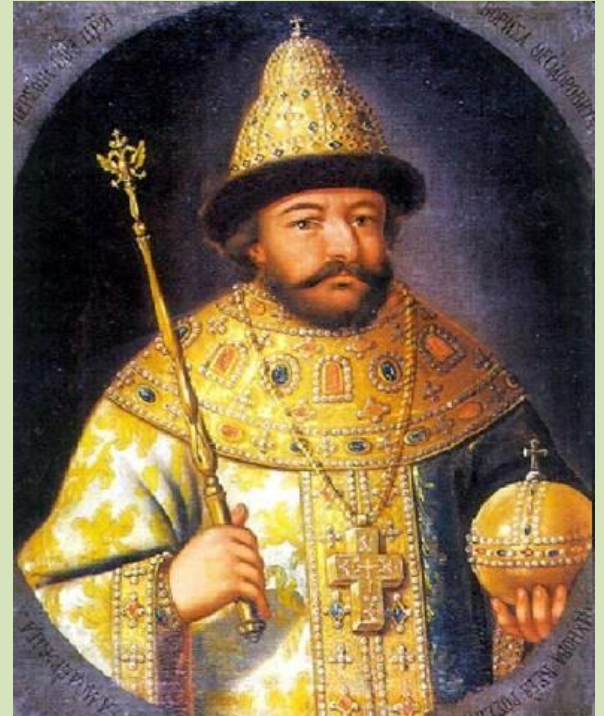
Борис Годунов. Парсуна XVI в.