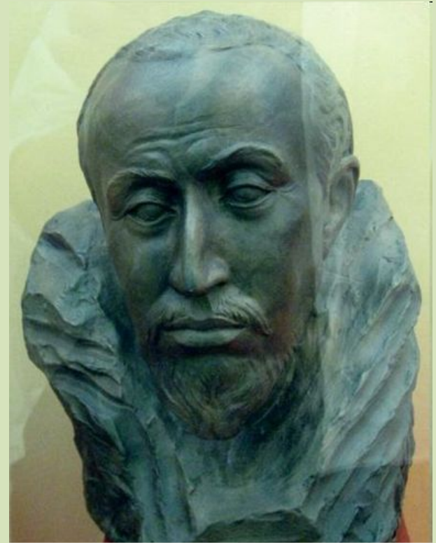
Царь Федор Иоаннович — реконструкция его облика по черепу, выполненная профессором М. М. Герасимовым.

• http://student-hist.ru/fedor-ioannovic/pravlenie-fedora-ivanovica/