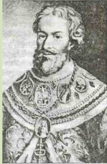
Федор Никитич Романов