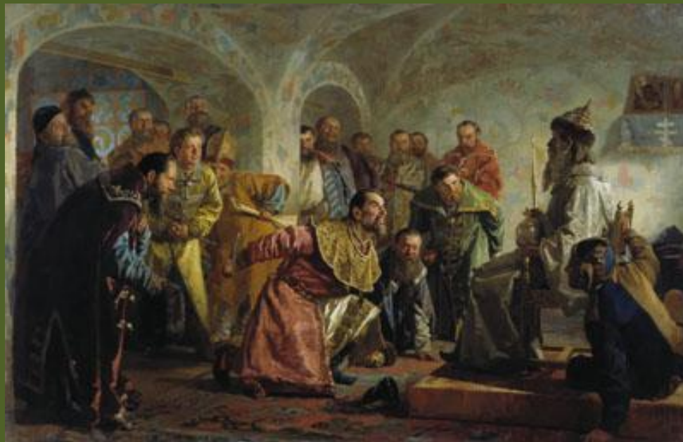
Опричники. Худ. Н. Неврев.