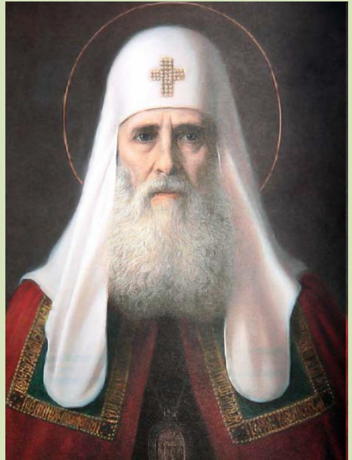
Иов – 1-й патриарх