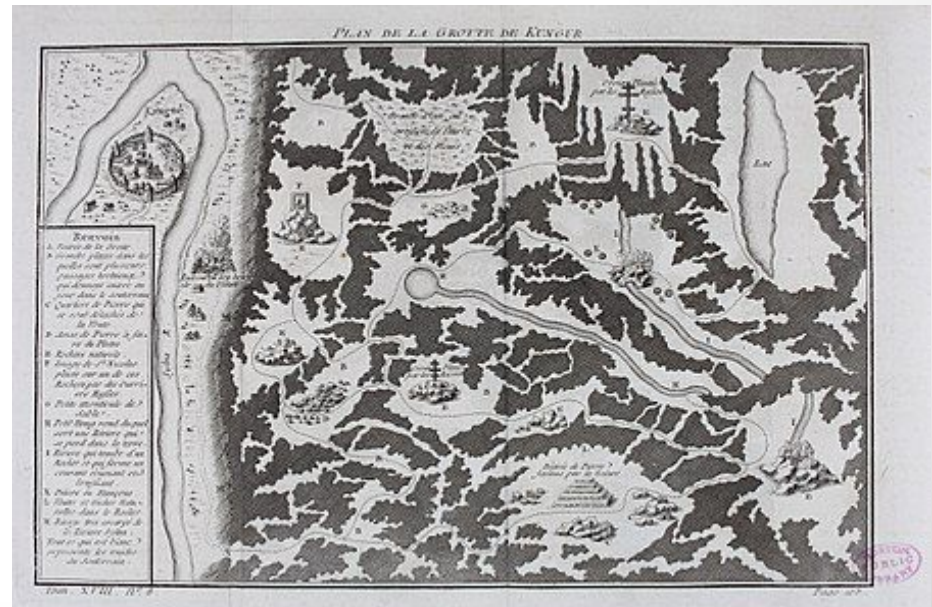
План Кунгурской пещеры (1768)