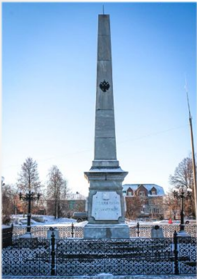
Обелиск в честь защитников Кунгура