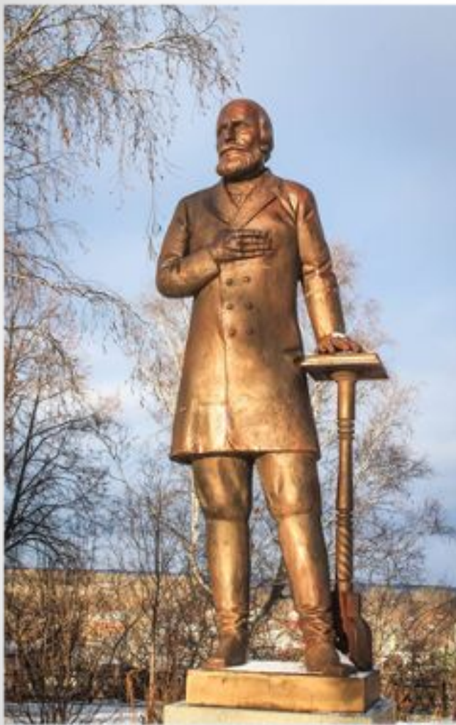
Памятник купцу А.С. Губкину