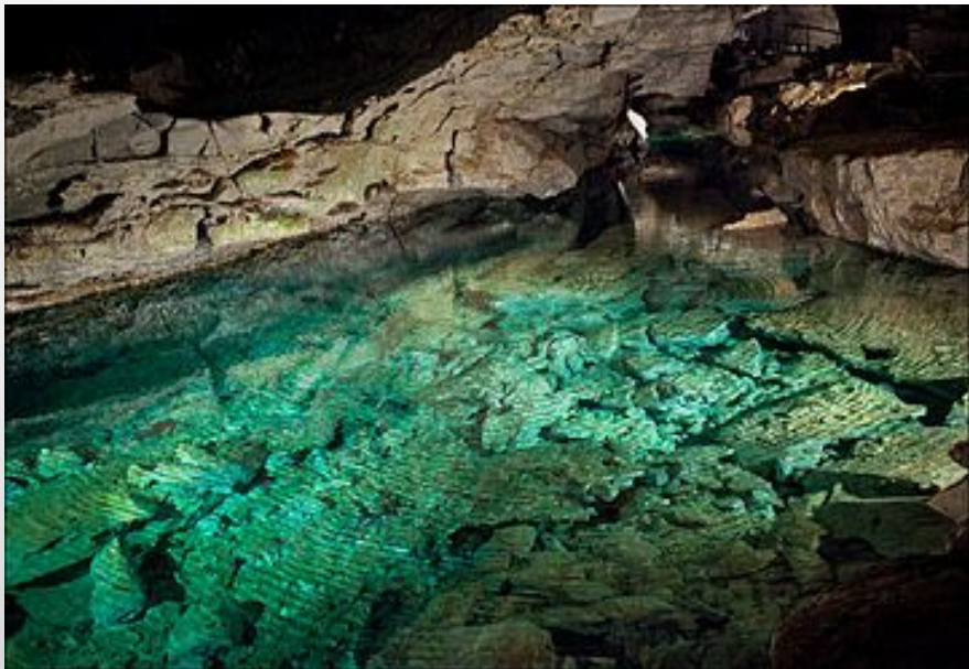
Подземное озеро в Кунгурской пещере