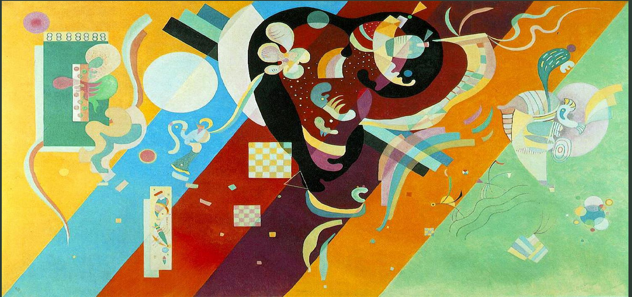
Кандинский Василий " Композиция IX "