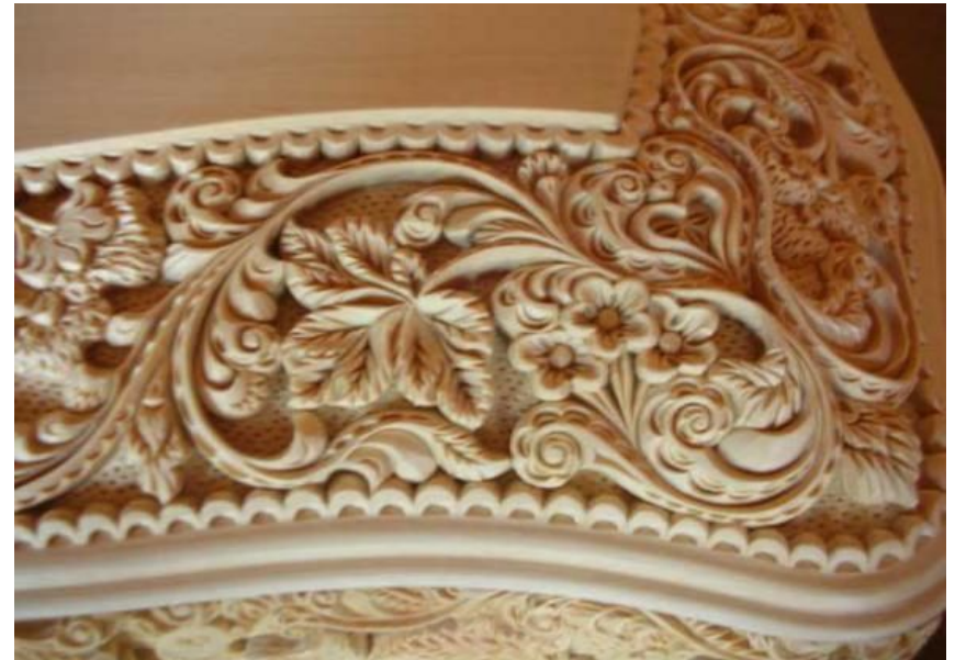
Контурная (объемная) резьба