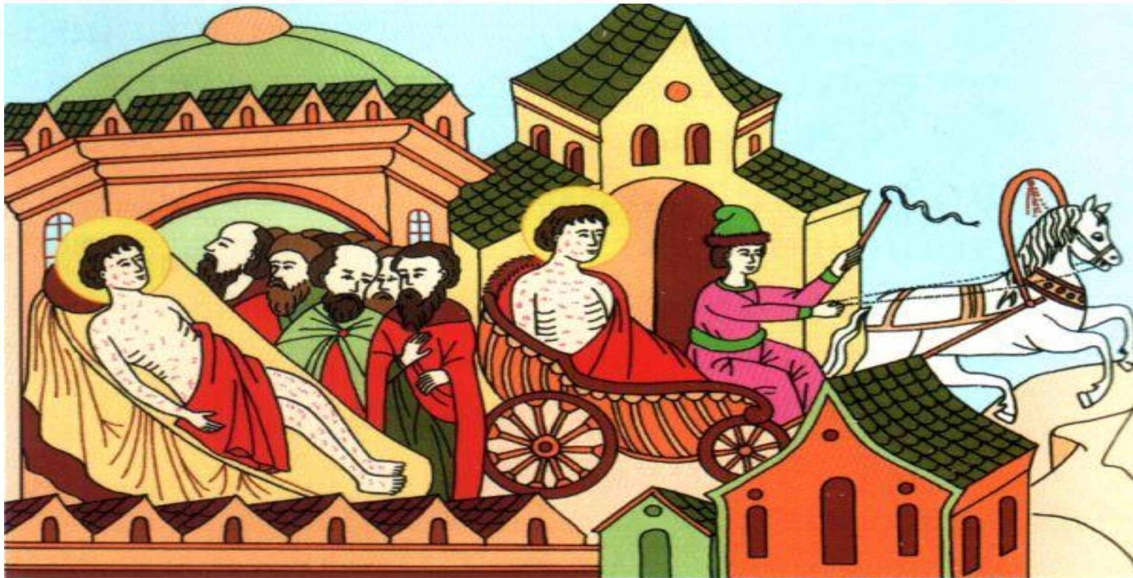
Святой князь Пётр едет в Рязанскую землю к врачам