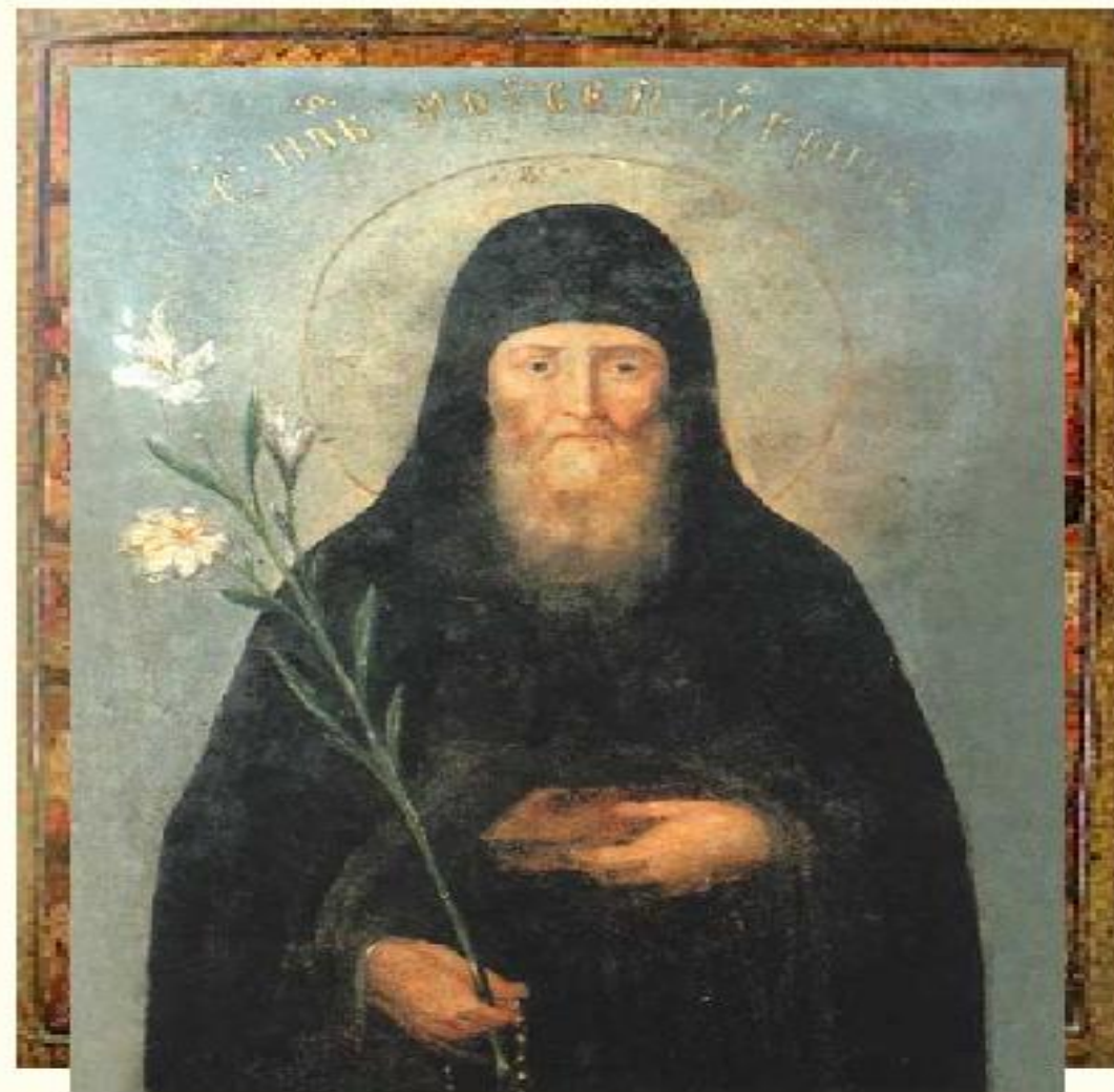
Повесть о Петре и Февронии. Автор: Ермолай-Еразм.