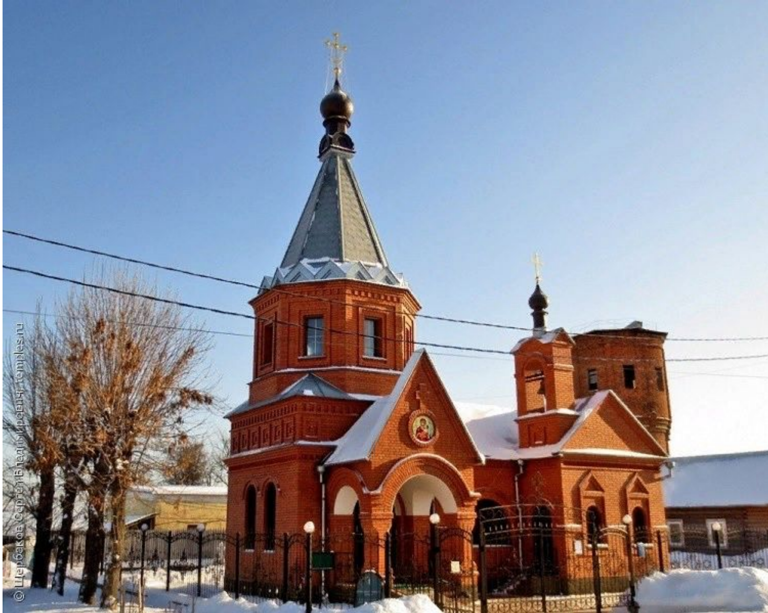
Крестовоздвиженский женский монастырь в Муроме