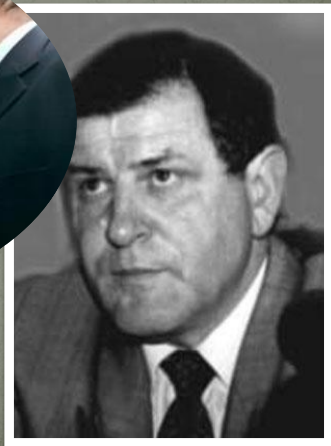
Вацлав Клаус и Владимир Мечъяр