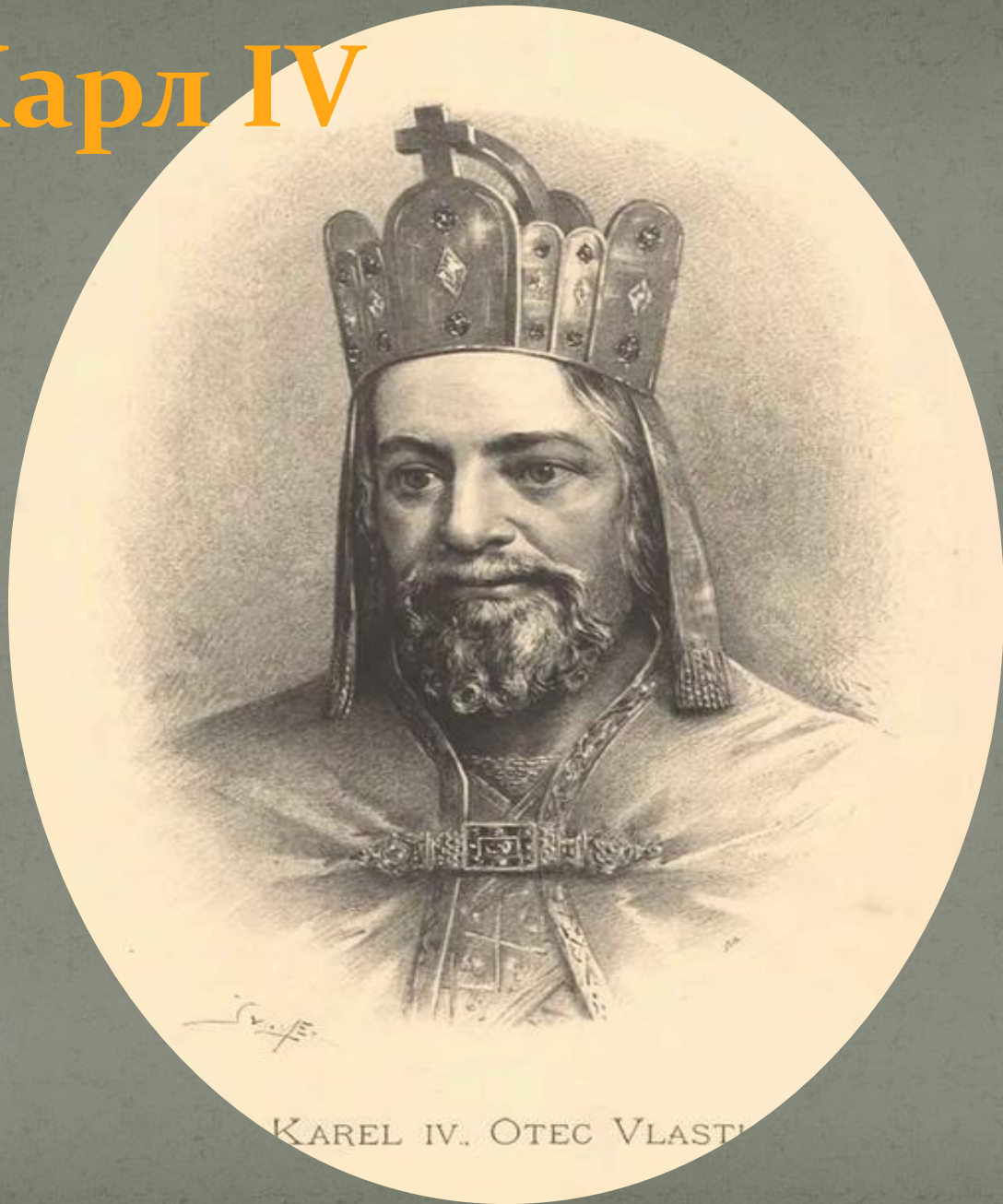
KAREL IV. OTEC VLASTI