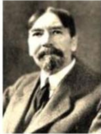
ВЕБЛЕН Торстейн Бунде (1857–1929)