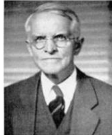
МИТЧЕЛЛ Уэсли Клэр (1874–1948)

Институционально- статистическое направление