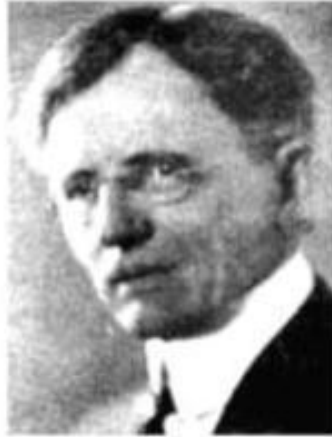
КОММОНС Джон Роджерс (1862–1945)