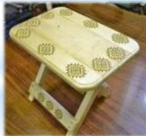
Роспись по дереву