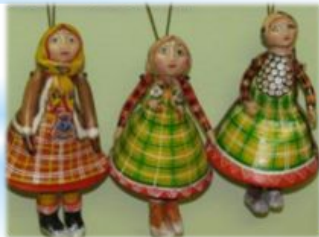
Изделия из глины