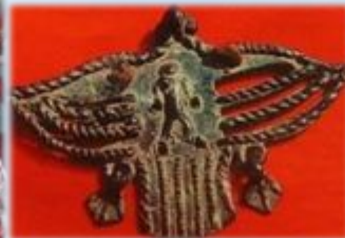
Резьба по дереву и литьё из металла