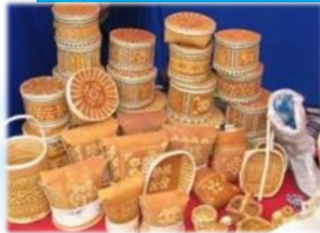
Изделия из бересты и лозы