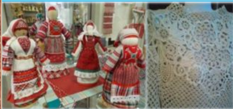
Лоскутное рукоделие и кружево