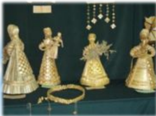
Плетение из соломки и лыка