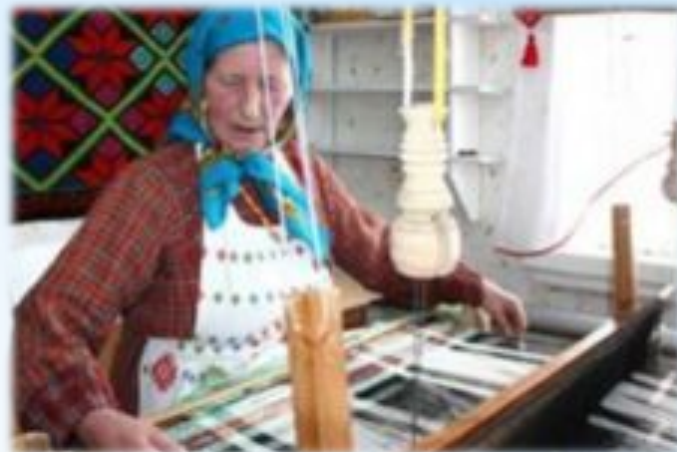
Ткачество и вышивка