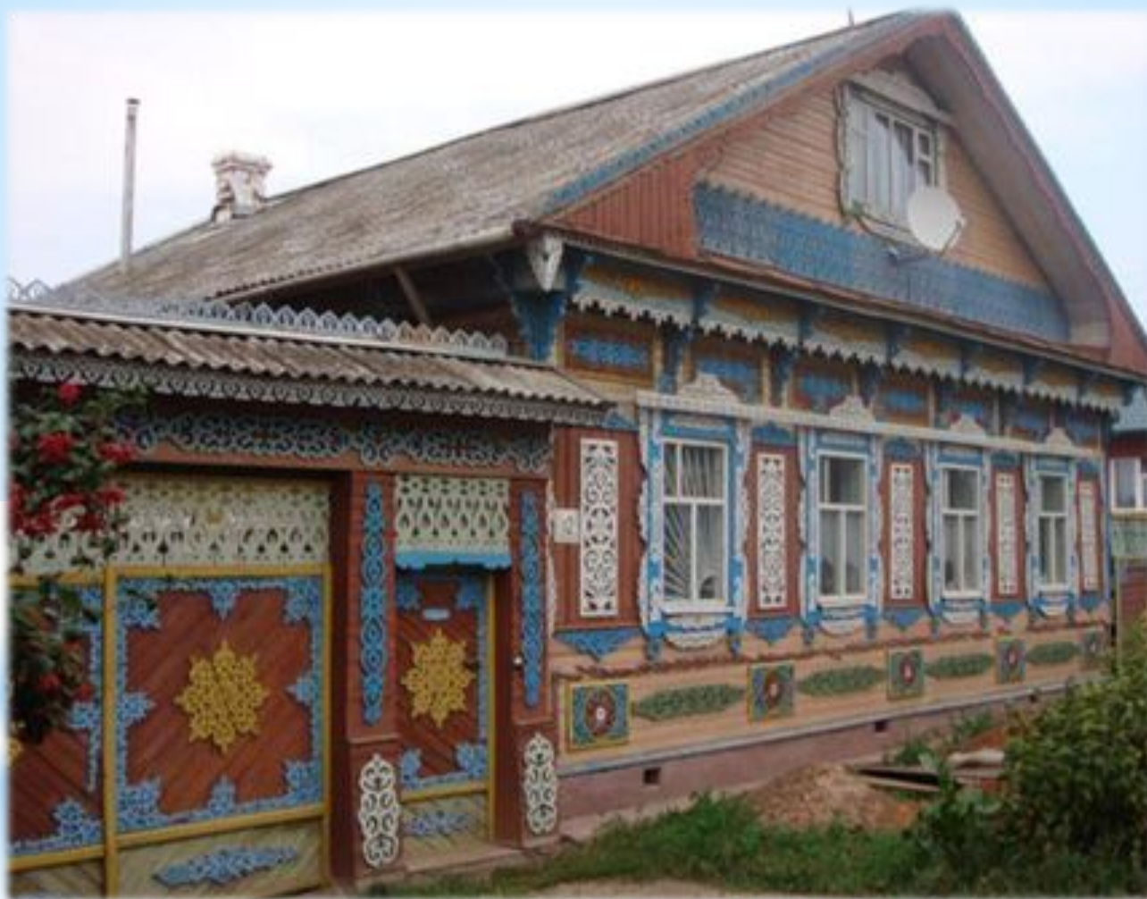
«Русские Хоромы» - Рубленные деревянные дома