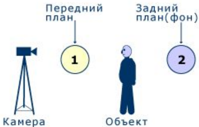
Рис. 4 (вид сбоку)