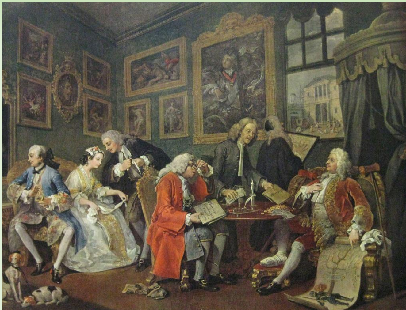
У. Хогарт. Модный брак.

Т В Европе нового времени в брак вступали довольно поздно. В среднем, в XVIII веке мужчинам было 28-29 лет, женщинам 25-26 лет. В состоятельных буржуазных семьях женились раньше, в дворянских еще раньше, там невесте могло быть 18 а жениху 21.