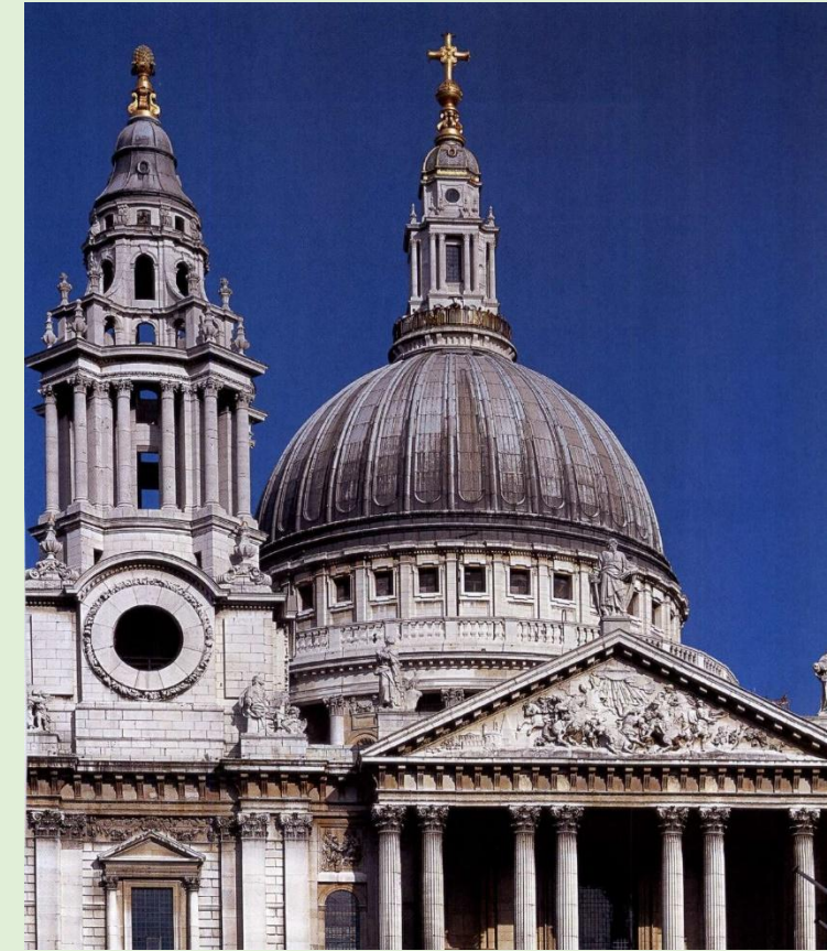
Собор Святого Павла в Лондоне