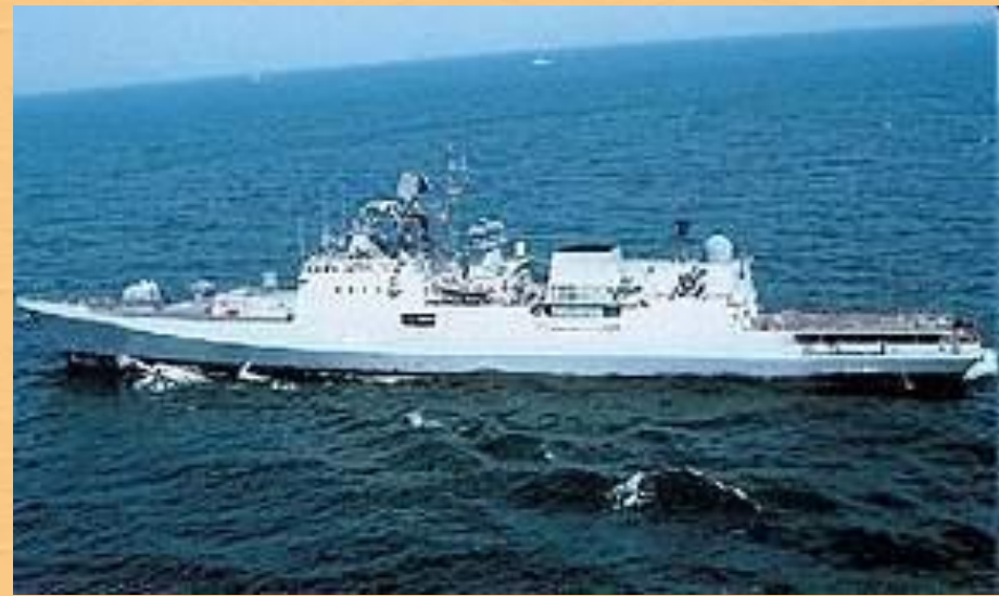
Индийский военный корабль "Табар"