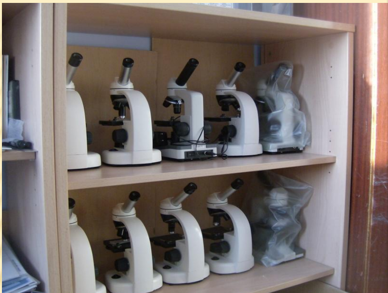
Микроскопы школьные ШМ-1