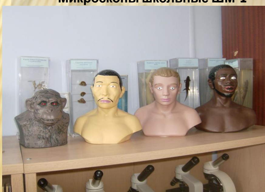
Основные расы вида Homo sapiens