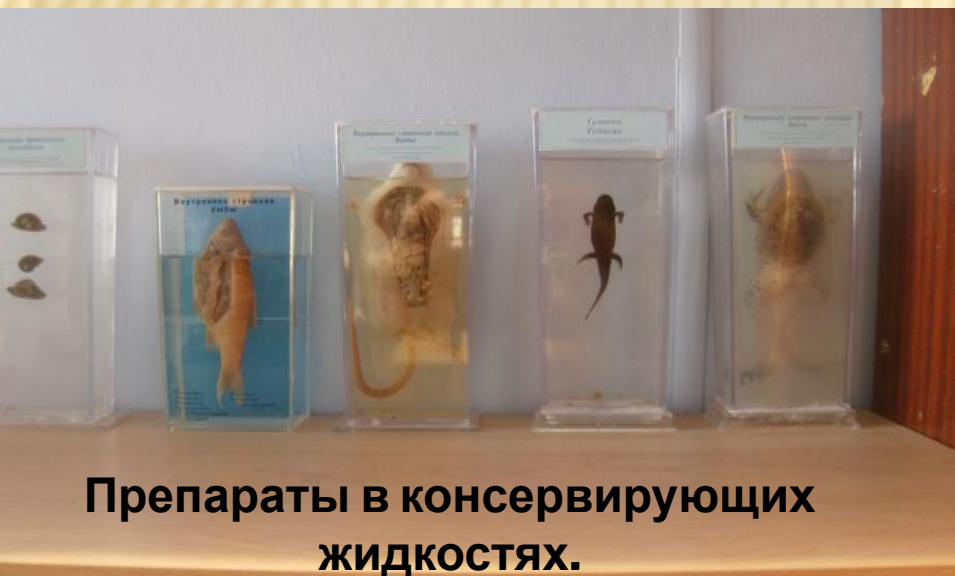
Препараты в консервирующей жидкостях.