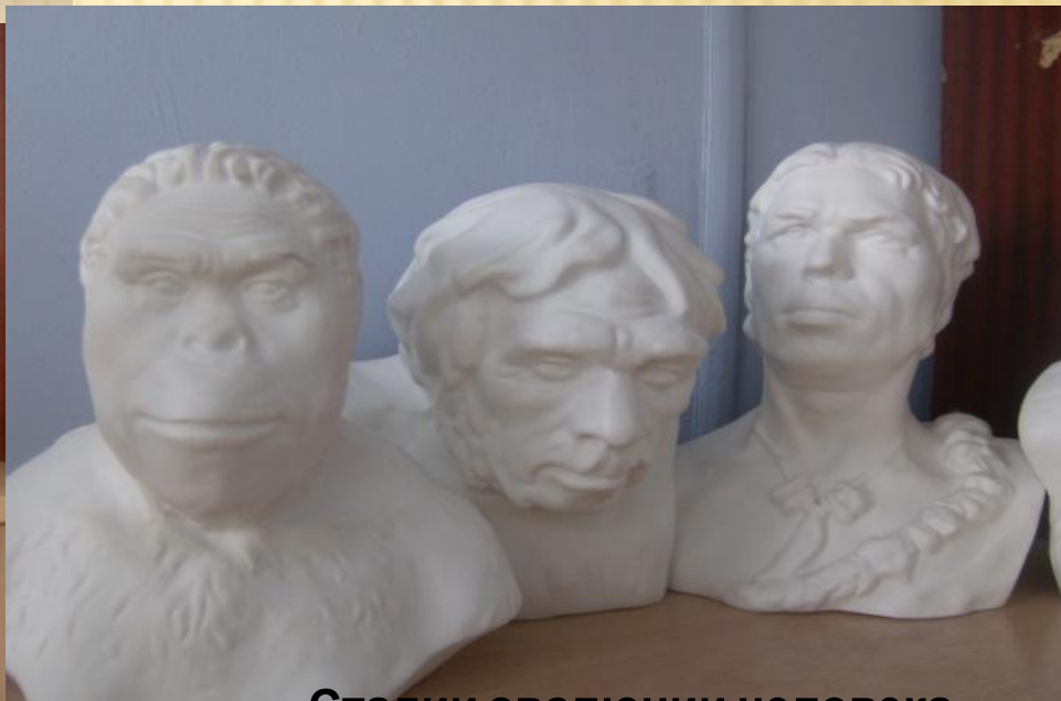
Стадии эволюции человека