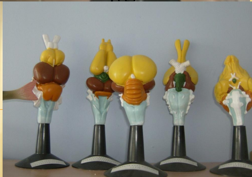
Головной мозг хордовых