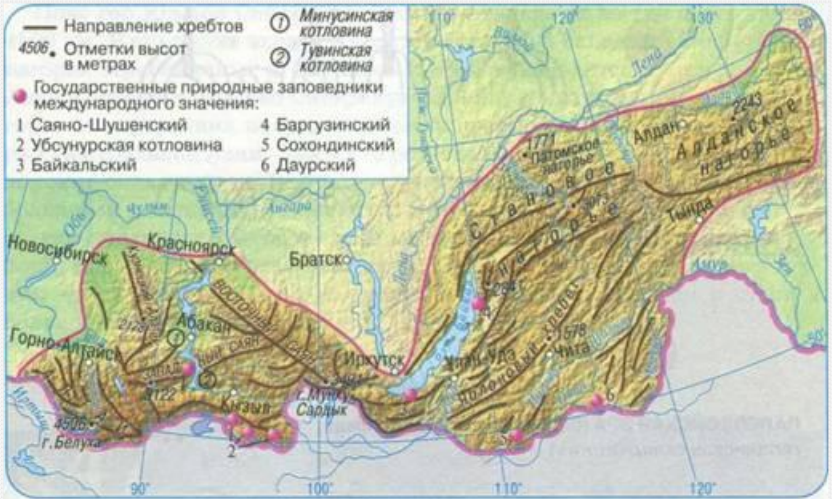
Рис. 211. Орографическая схема Южной Сибири