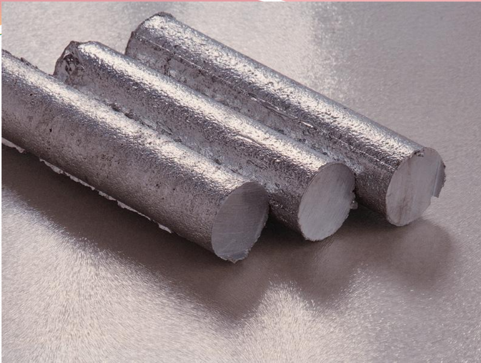
А так выглядит цинк