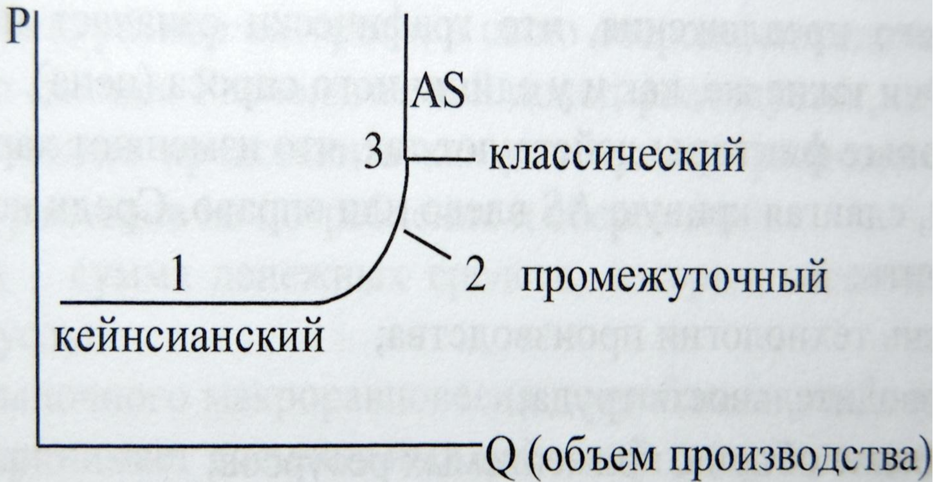
45. Кривая совокупного предложения (AS) с учетом временного периода