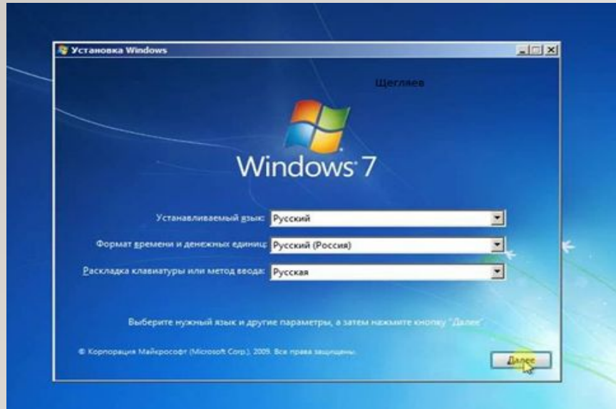
Рисунок 2 - Установка операционной системы

Для выполнения практической части курсовой работы, нам необходимо установить виртуальную машину Oracle Virtual Box. В качестве операционной системы на всех рабочих станциях будет установлена Windows 7 Корпоративная.