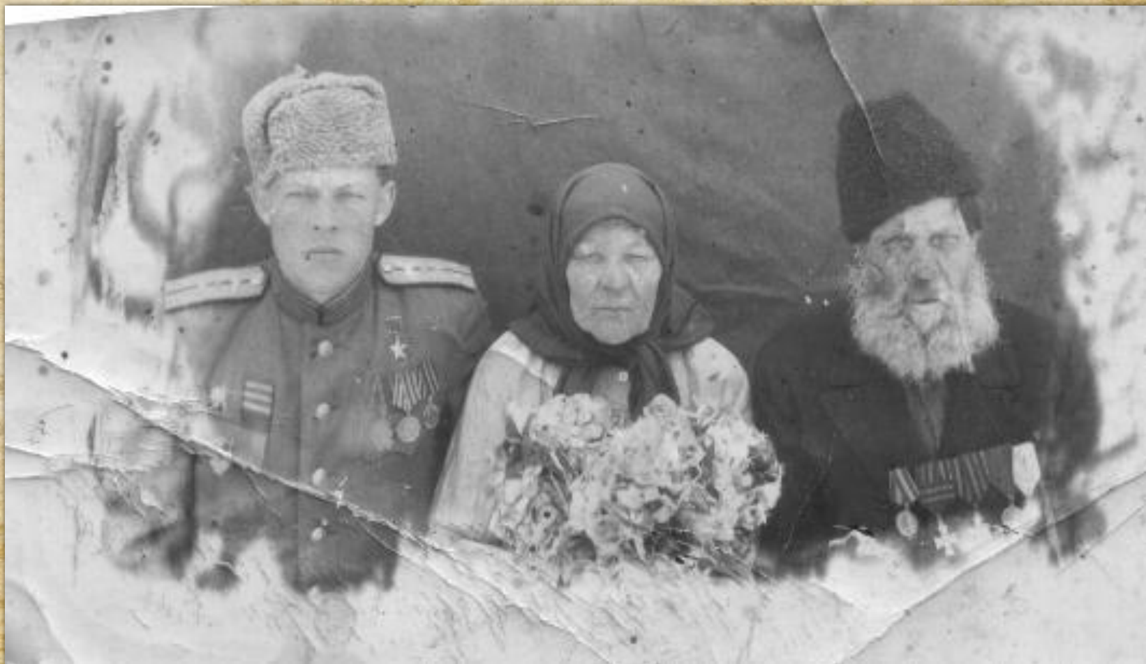
Фото 1945 года