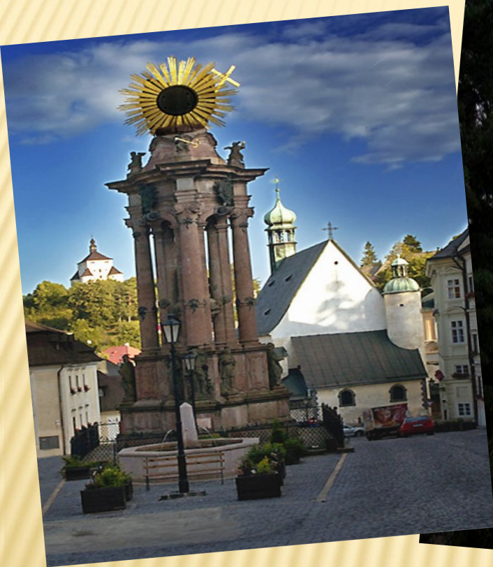
Ұлы Троицы алаңы