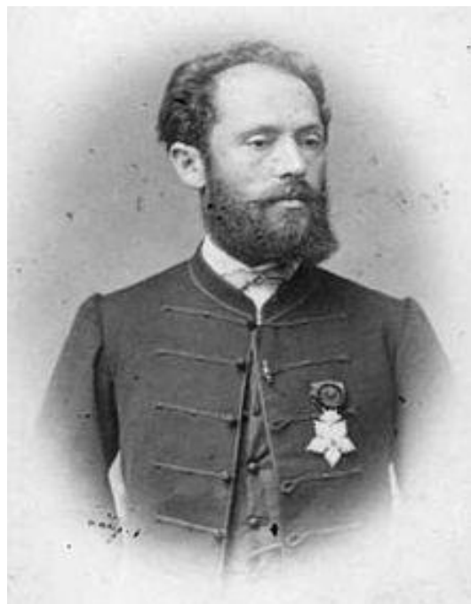
Арминий Вамбери (13.3.1832 — 15.9.1913) — венгр түркітанушысы, этнограф, саяхатшы.