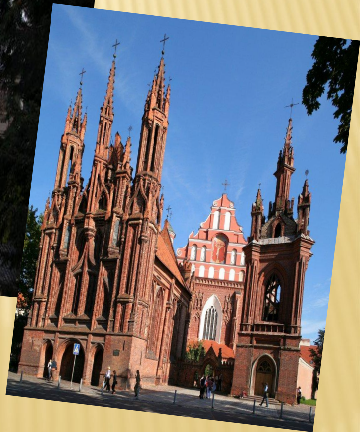
Ұлы Анна храмы