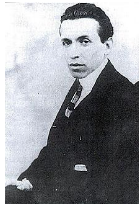
Тибор Самуэли (27.09.1890,— 2.08.1919.) Венгр жұмысшы қозғалысының қайраткері.