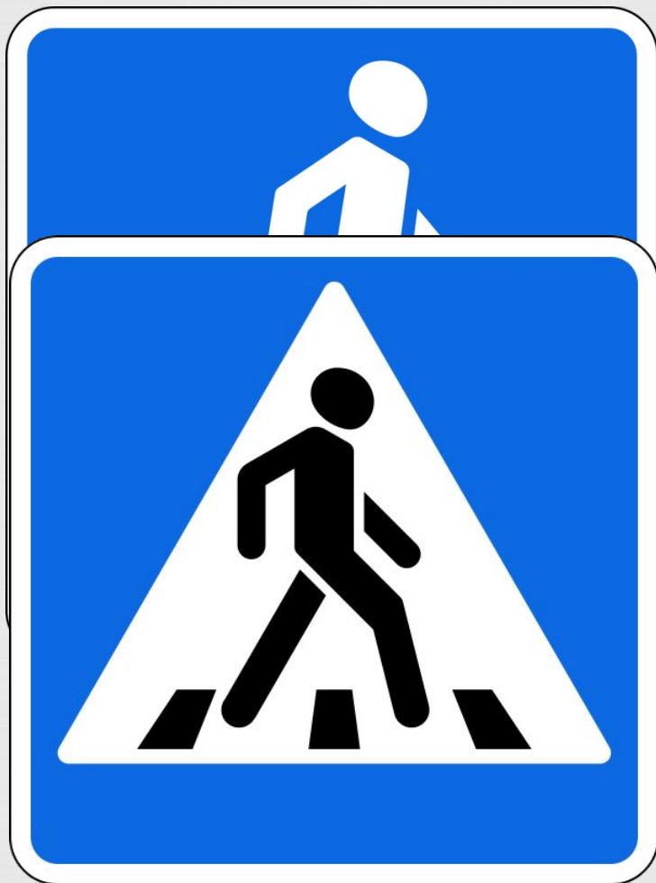
□ Пешеходный переход