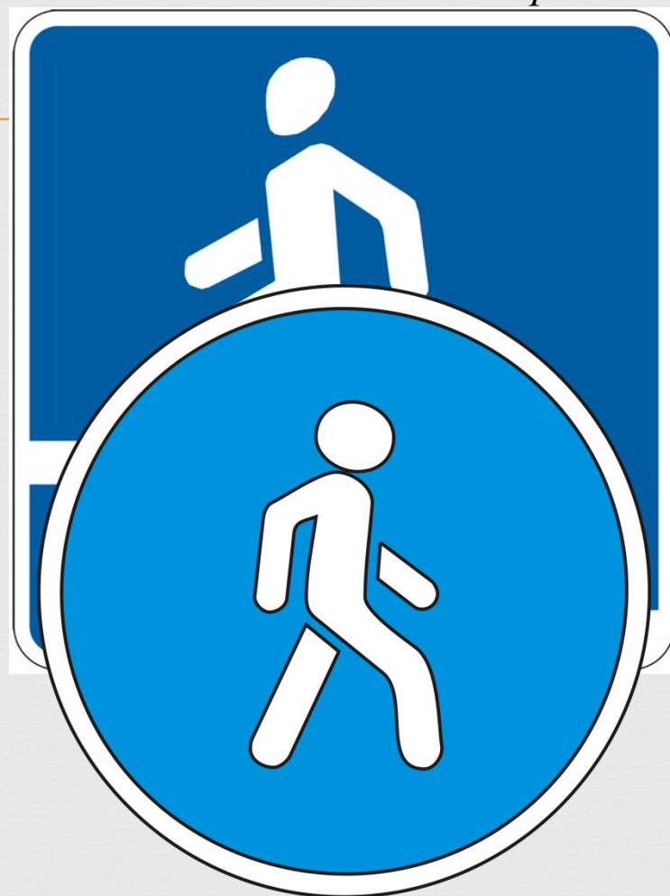
□ Пешеходная дорожка