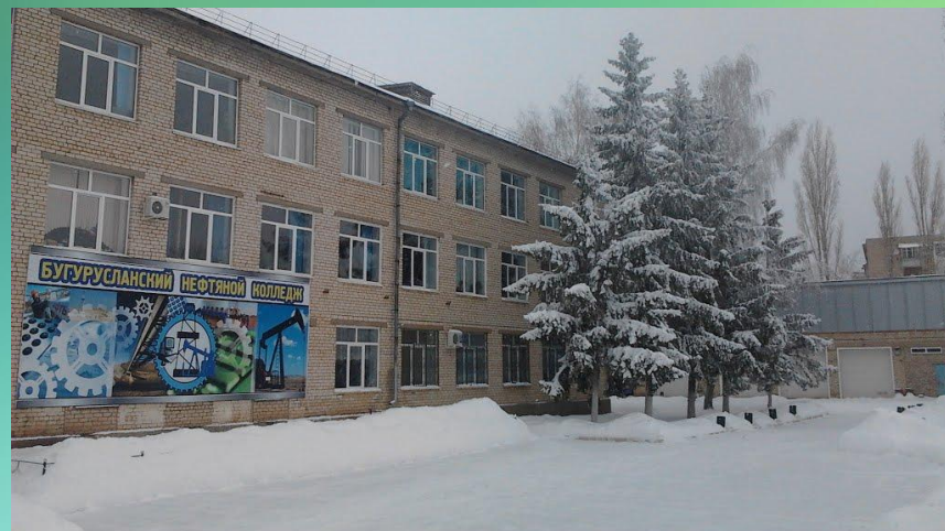
Бугурусланский нефтяной колледж