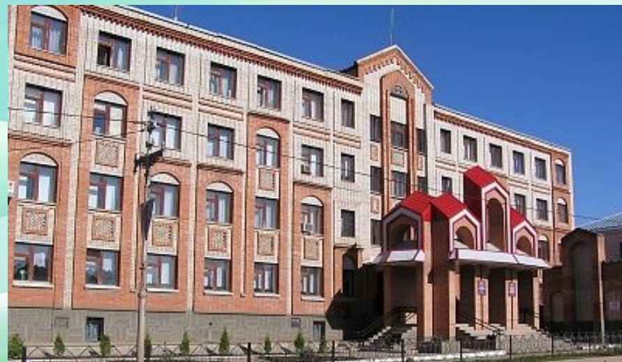
Сельскохозяйственный техникум, г. Бугуруслан