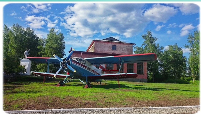
Бугурусланское летное училище ГА (колледж) - филиал ФГБОУ ВО "Санкт-Петербургский государственный университет ГА"