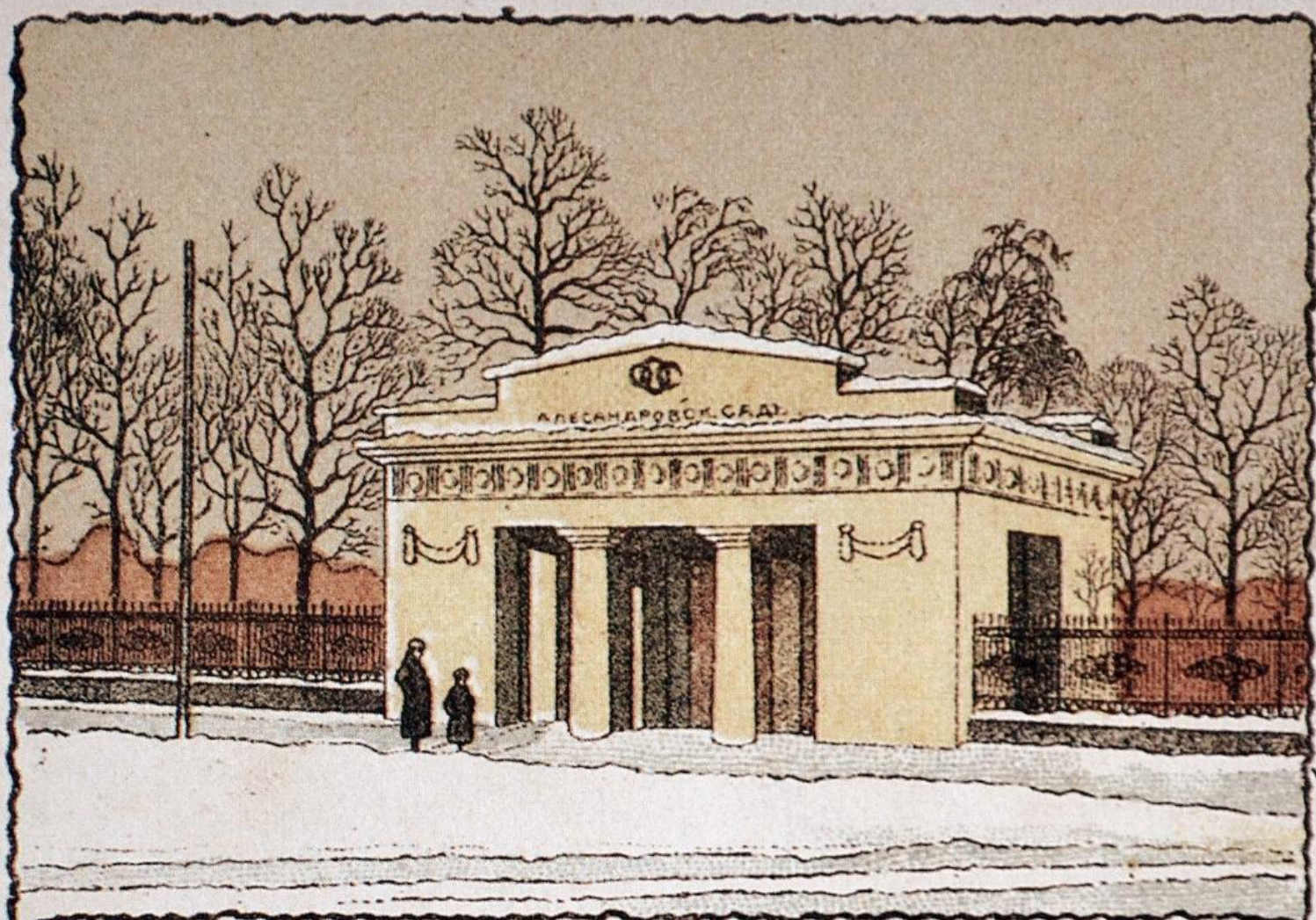
рис. А. Мухоморова