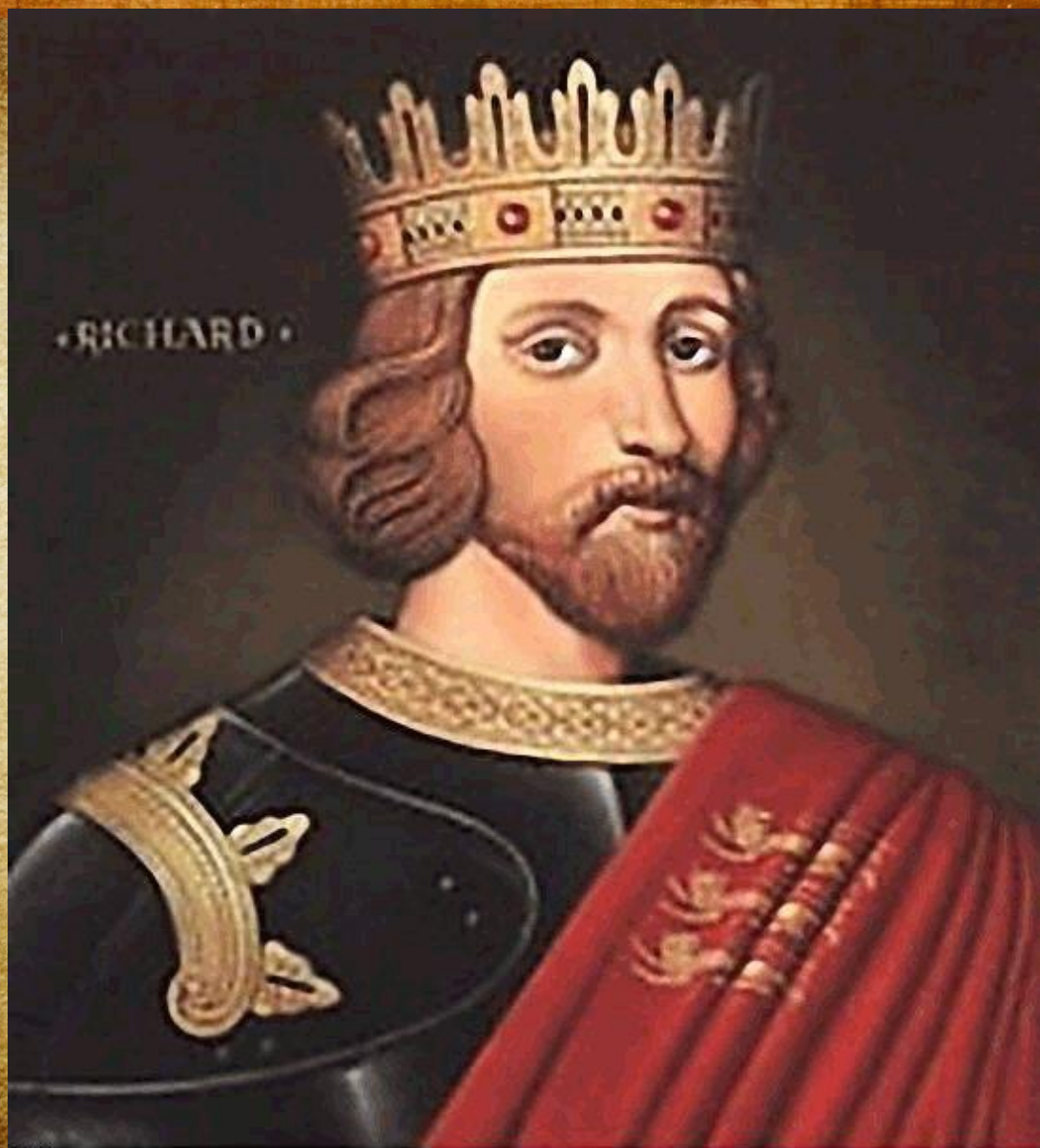
Портрет Ричарда Львиное сердце