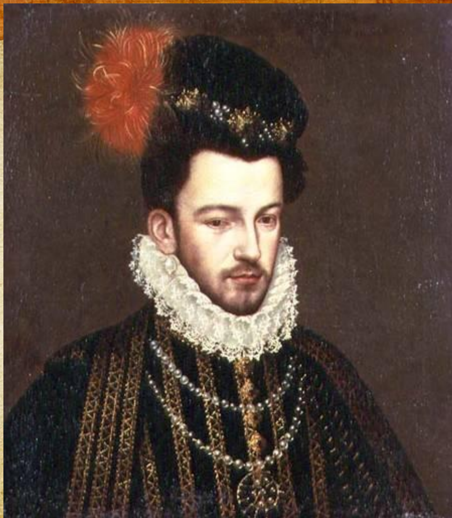
Портрет Генриха Третьего