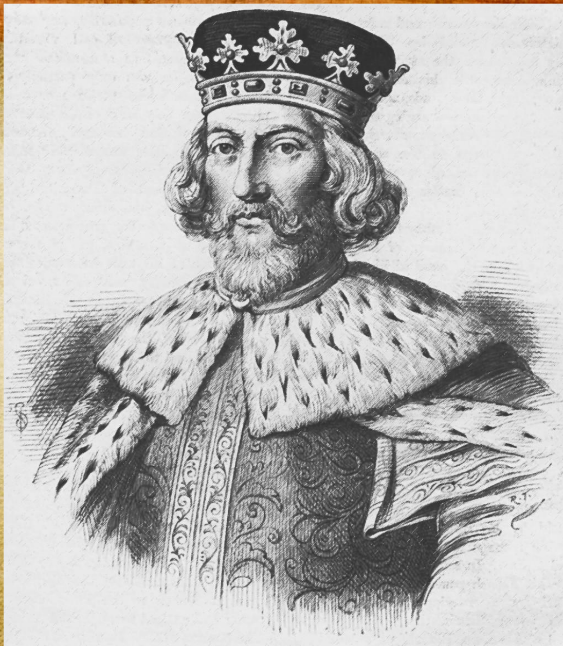
Портрет Иоанна Безземельного