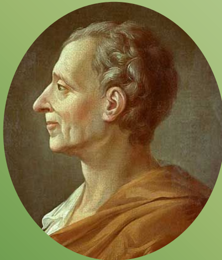
Ш. Л. Монтескье