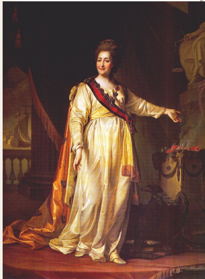
Екатерина II (в виде законодательницы в храме богини правосудия)