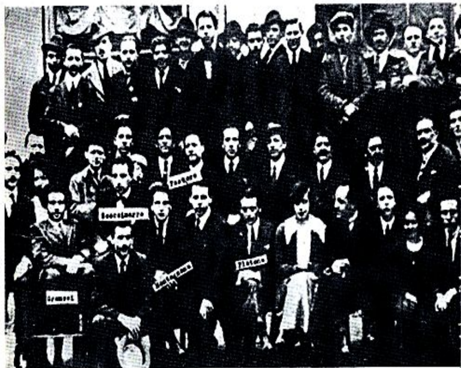
La redazione e i tipografi dell'Ordine Nuovo quotidiano del 1922

Створення корпоративної системи в Італії