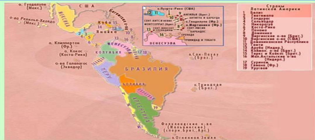
Состав. Политическая карта региона.