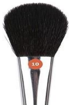
Jean's КИСТЬ ДЛЯ РУМЯН

№09 - 12 мм Изготовлена из волоса черной кожи. Предназначена для нанесения сухих компактных, рассыпчатых и шариковых румян. Куполообразная форма позволяет равномерно наносить и распределять румяна. Материал ручки - дерево.