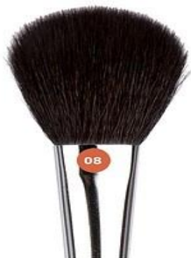
Jean's КИСТЬ ДЛЯ РУМЯН

№08 - 12 мм Изготовлена из волоса синей белки. Мягкая на ощупь, очень комфортна в использовании. Предназначена для нанесения сухих компактных, рассыпчатых и шариковых румян. Куполообразная форма обеспечивает равномерное распределение румян. Материал ручки - дерево.