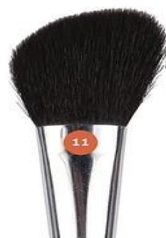
Jean's КИСТЬ ДЛЯ РУМЯН

№10 - 12 мм Изготовлена из волоса черной кожи. Предназначена для нанесения сухих компактных, рассыпчатых и шариковых румян. Куполообразная форма позволяет равномерно наносить и распределять румяна. Материал ручки - дерево.