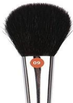
Jean's КИСТЬ ДЛЯ РУМЯН

№08 - 12 мм Изготовлена из волоса синей белки. Мягкая на ощупь, очень комфортна в использовании. Предназначена для нанесения сухих компактных, рассыпчатых и шариковых румян. Куполообразная форма обеспечивает равномерное распределение румян. Материал ручки - дерево.