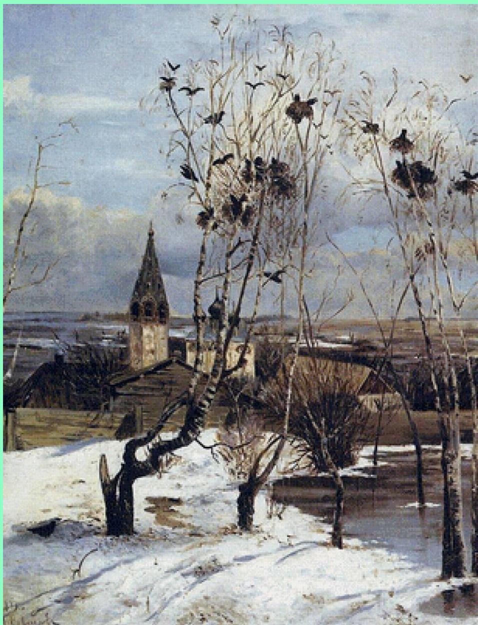
А.Саврасов. Грачи прилетели.