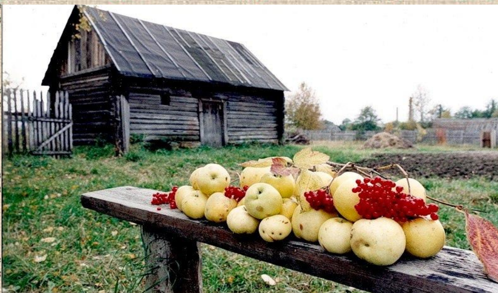
Избы в селе Гахово Медвенского района Курской области