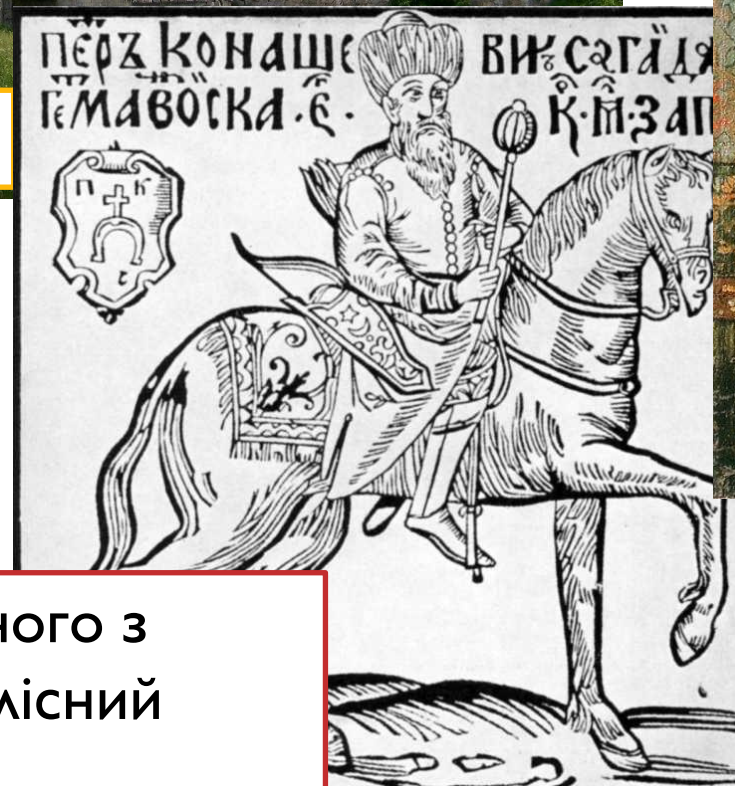
Портрет Сагайдачного з книги «Вірші на жалісний погреб» (гравюра)