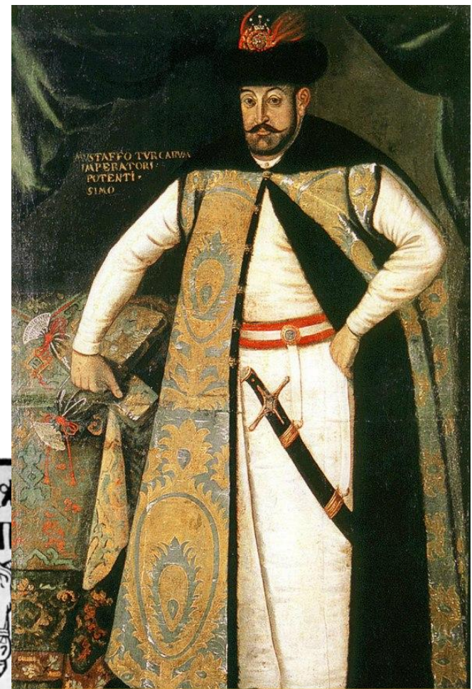
Портрет князя Криштофа Збараського. Після 1622 (портретний живопис).