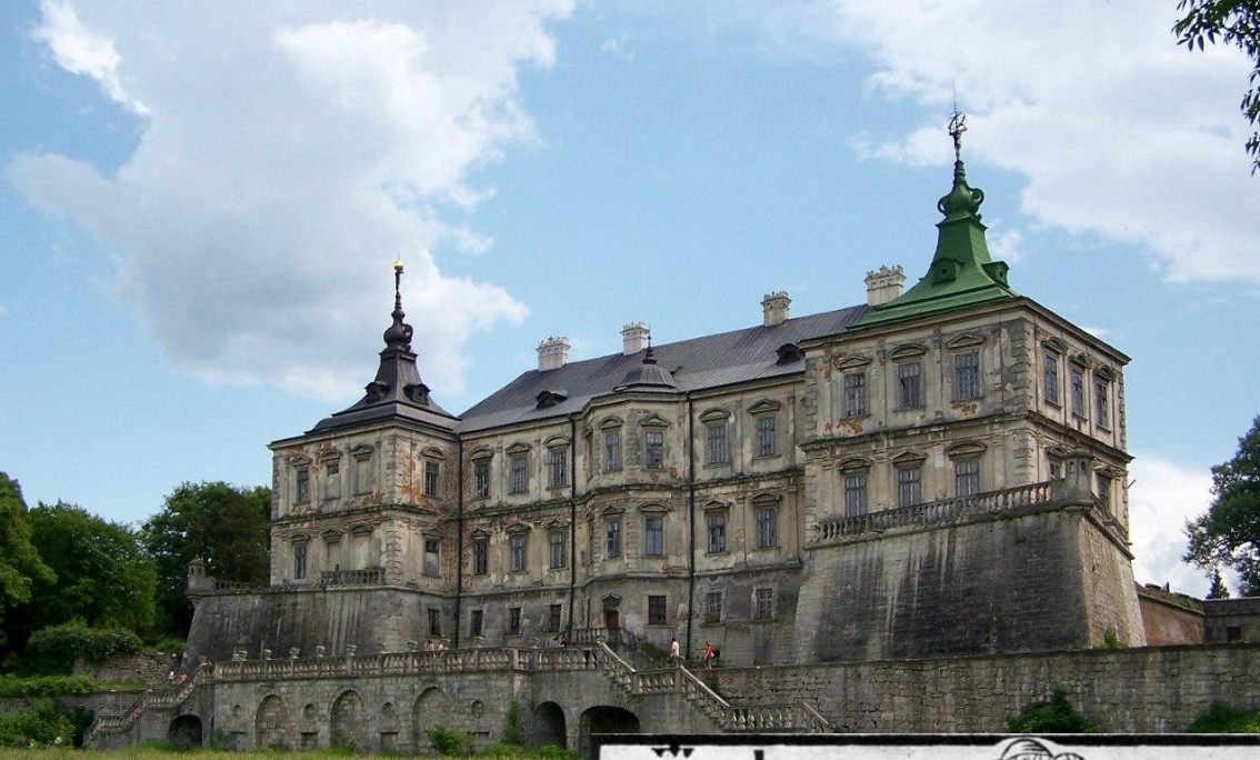
Замок у Підгірцях