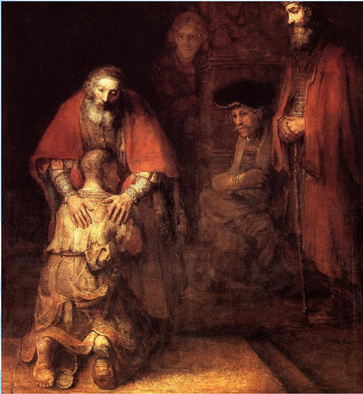
«Возвращение блудного сына» Рембрандт