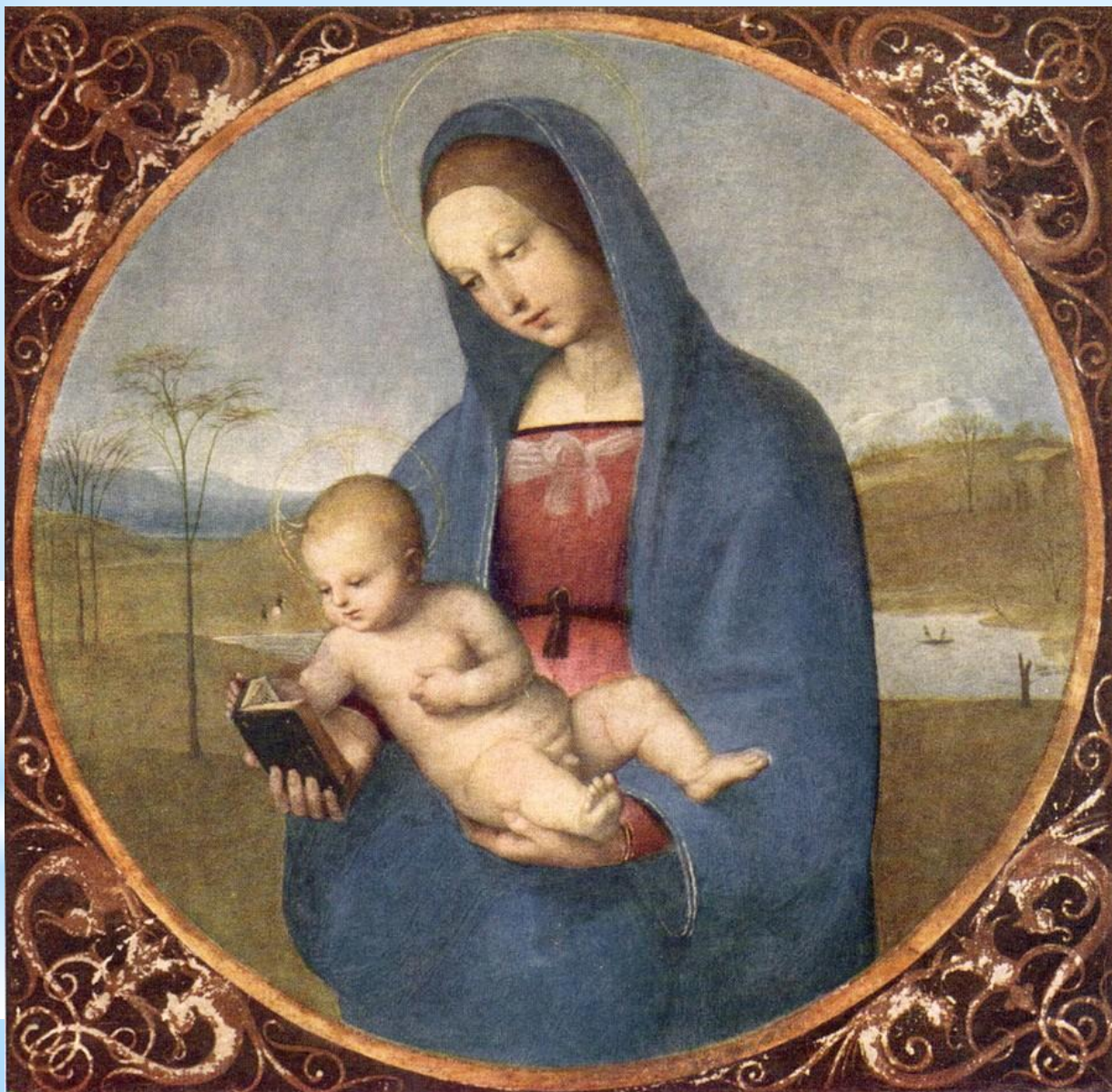
«Мадонна Конестабиле» Рафаэль