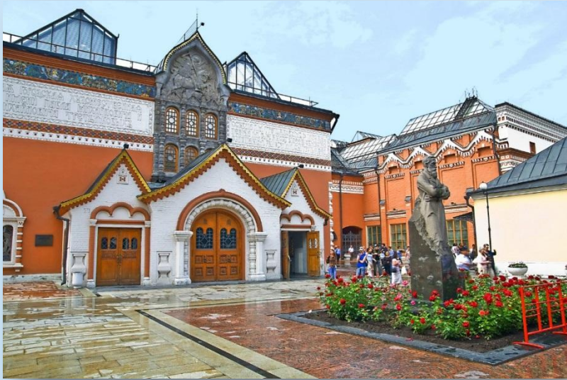
в Третьяковской галерее