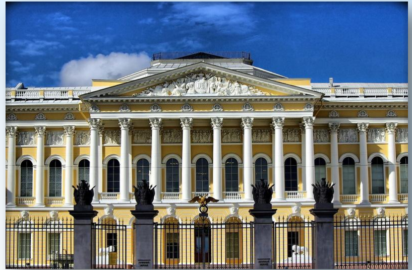
в Русском музее