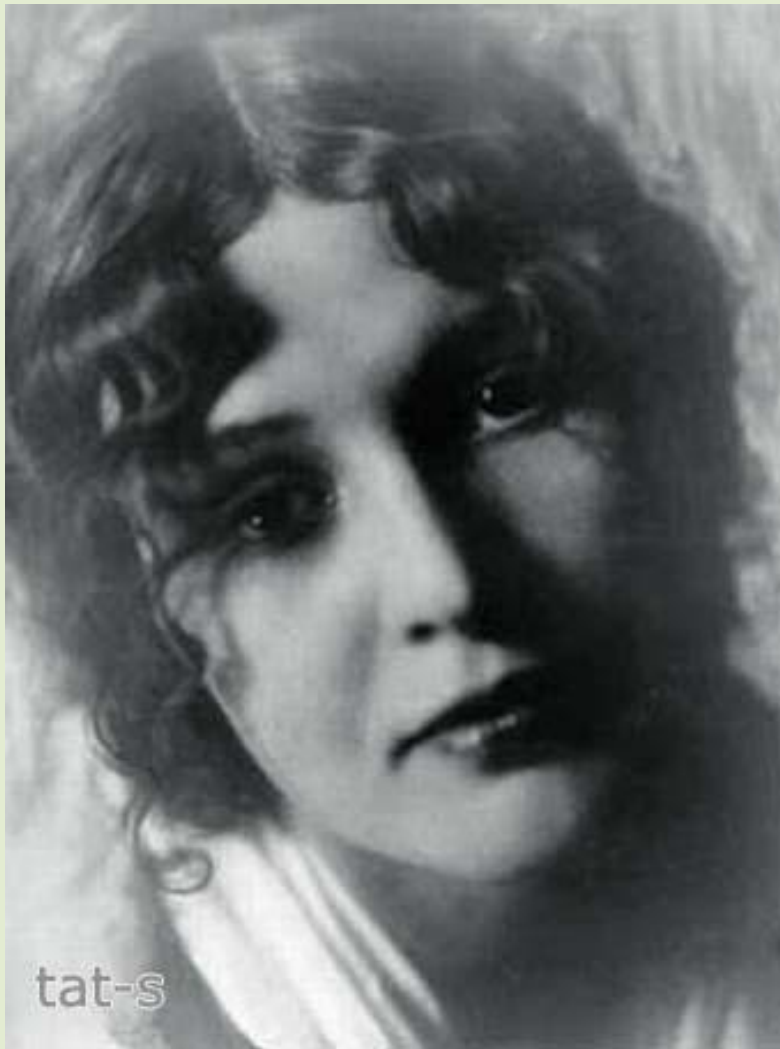
Жена Есенина, актриса - Зинаида Николаевна Райх (1894 - 1939)

30 июля 1917 года Есенин (21 год) обвенчался актрисой Зинаидой Райх в церкви Кирика и Улиты Вологодского уезда.