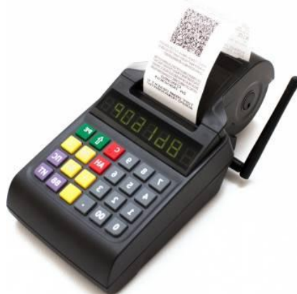
АТОЛ 90Ф без ФН от 17500 ₺