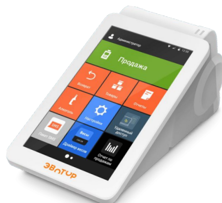
Эвотор без ФН от 26 000 ₺