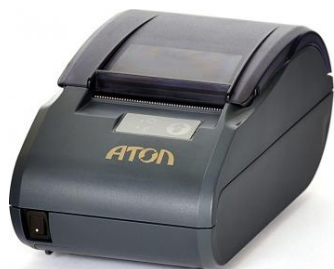
АТОЛ 30Ф ФН от 20 000 ₺