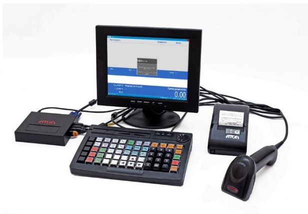
POS Система АТОЛ от 25000 ₺