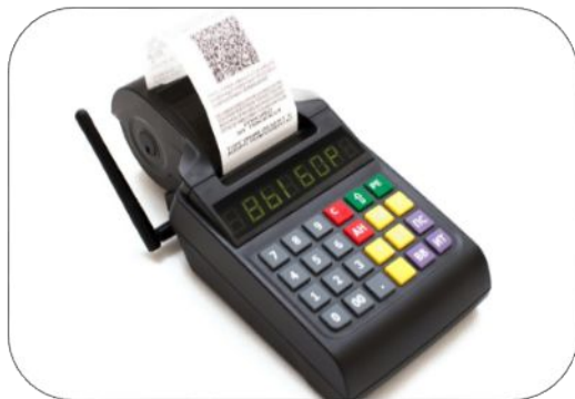
ККТ, соответствующая 54 ФЗ