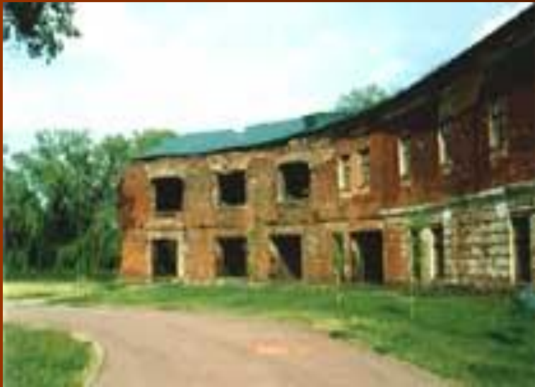
Руины Южной казармы

«Отражая вероломное и внезапное нападение гитлеровских захватчиков на Советский Союз, защитники Брестской крепости в исключительно тяжелых условиях проявили в борьбе с немецко-фашистскими агрессорами