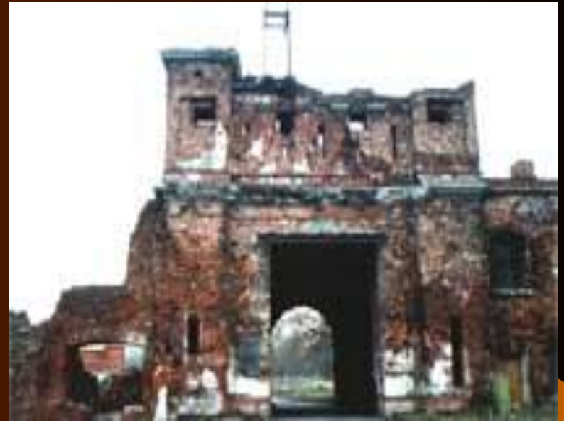
Руины Тереспольских ворот

выдающуюся воинскую доблесть, массовый героизм и мужество, ставшие символом беспримерной стойкости советского народа». (Из Указа Президиума Верховного Совета СССР от 08.05.1965).