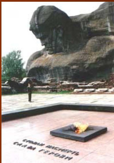
Главный монумент и вечный огонь

. К моменту нападения в крепости было от 7 до 8 тысяч советских воинов, здесь же жило 300 семей военнослужащих. С первых минут войны Брест и крепость подверглись массированным бомбардировкам с воздуха и