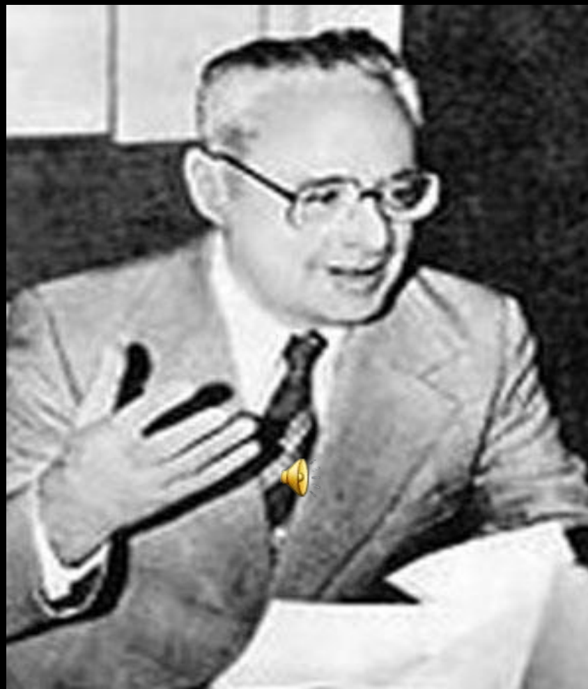
Юрий Борисович Левитан - директор Государственного комитета Совета Министров СССР по телевидению и радиовещанию.