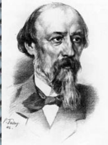
Н.А.Некрасов - редактор журнала "Современник".

В 50-е годы журнал «Современник» объединял вокруг себя крупнейших демократических и либерально настроенных писателей. К концу 50-х годов писатели умеренного направления окончательно порывают с журналом, и он становится органом революционной демократии. Идейным руководителем журнала стал Чернышевский. Революционно-демократический лагерь в литературе представляли также Герцен, Добролюбов, Некрасов, Салтыков-Щедрин. Им противостояли литераторы, тяготевшие к либеральным и умеренно монархическим взглядам. Наиболее значительными из них были Тургенев и Гончаров. Однако назревшая необходимость буржуазно-демократических преобразований и наличие демократического подъема в стране помогали в ряде случаев и этим художникам сохранить в своем творчестве глубину и силу социальной критики.